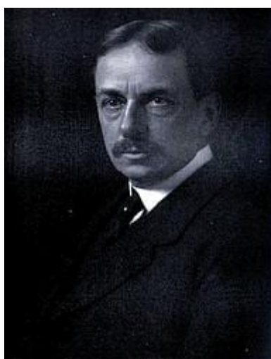
Henry Fairfield Osborn st. (8. srpna 1857 - 6. listopadu 1935)

Henry Fairfield Osborn byl paleontolog, geolog a ochránce přírody. Jako ředitel Amerického přírodovědného muzea ( American Museum of Natural History ) se zasazoval o zřizování diorám, nástěnných maleb a expozic s kostrami dinosaurů, které muzeu daly jeho současnou podobu. Nashromáždil pozoruhodnou sbírku fosilií obratlovců a pomáhal zorganizovat početné expedice. Sám vedl paleontologické výpravy na americký Jihozápad a podílel se na pojmenování řady dinosaurů, včetně Tyrannosaurus Rex a Velociraptor .