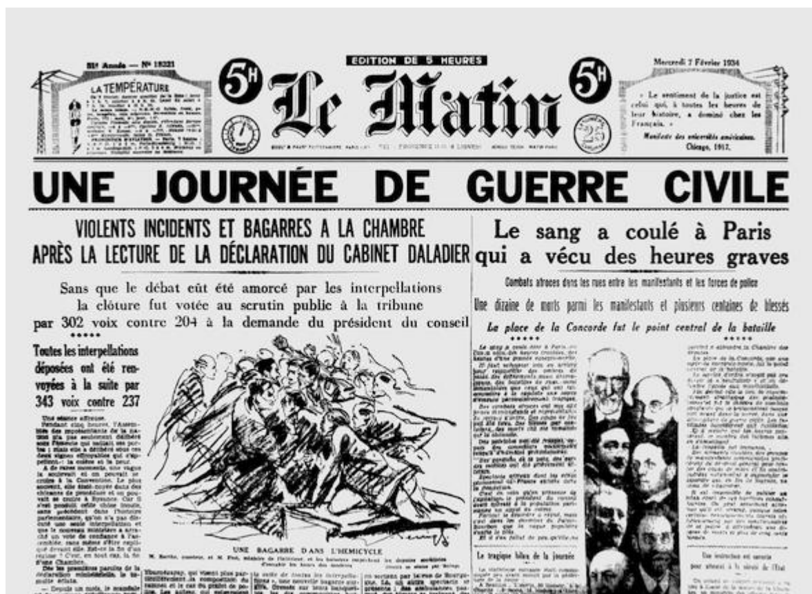
6. únor 1934: Den občanské války