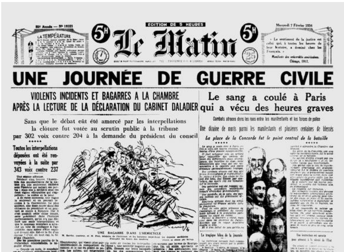
6. únor 1934: Den občanské války