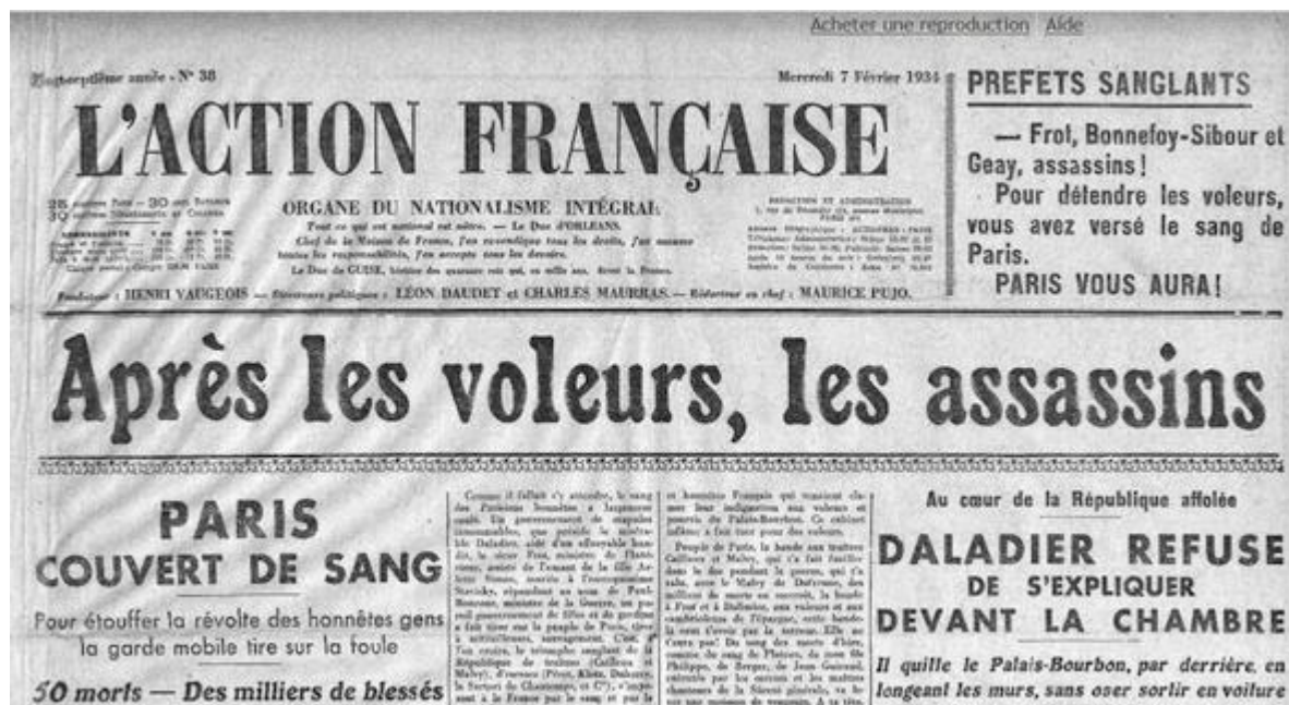
Po zlodějích vrazi