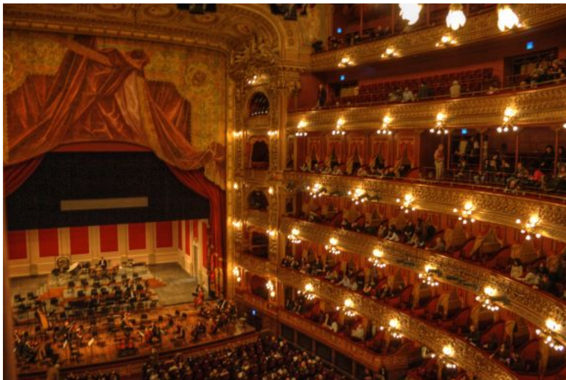
Teatro Colón (Kolumbovo divadlo) v Buenos Aires

Italská komunita v zemi pak stála za vybudováním pomníku Kryštofa Kolumba v Buenos Aires z roku 1921. Byl to jejich výraz díky nové zemi. Váží 623 tun a je 26 metrů vysoký. Byl vytesán z jediného kusu mramoru Carrara, lodí dopraveného z Itálie a sestaveného v Buenos Aires. V roce 2013, kdy venezuelský prezident Hugo Chávez obvinil italského objevitele z genocidy, však byl monument odstraněn a nahrazen sochou mestické hrdinky.