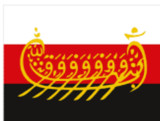
Национальная организация русских мусульман