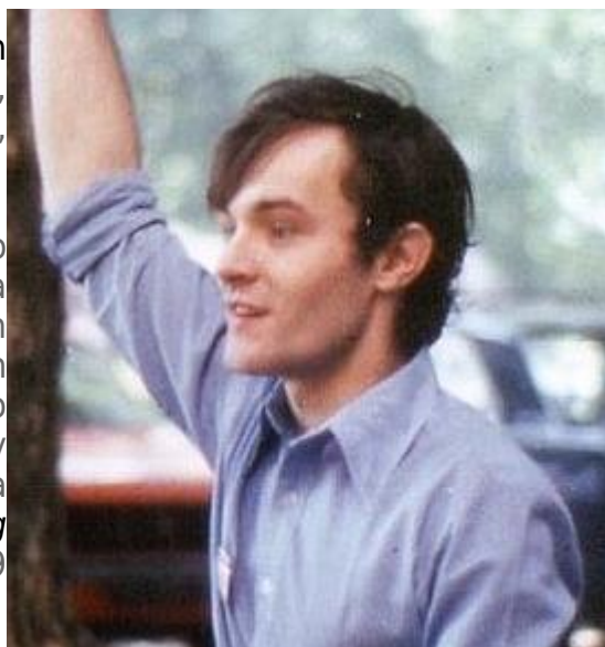
Guillaume Faye (foto z let 1969-70)

Atypický kandidát na hrdinu nového nacionalistického hnutí Faye léta pracoval jako rozhlasový bavič a příležitostný pornoherec, než se pustil do série knih volajících po „rekonquistě“ Evropy od muslimských imigrantů. Faye je dnes dle svých slov „opilec“, přesto stále pracuje na knize o blížícím se pádu Evropy s pracovním názvem Budoucí občanská válka (kniha vyšla pod názvem Ethnic Apocalypse: The Coming European Civil War u vydavatelství Arktos v roce 2019 – pozn. DP).