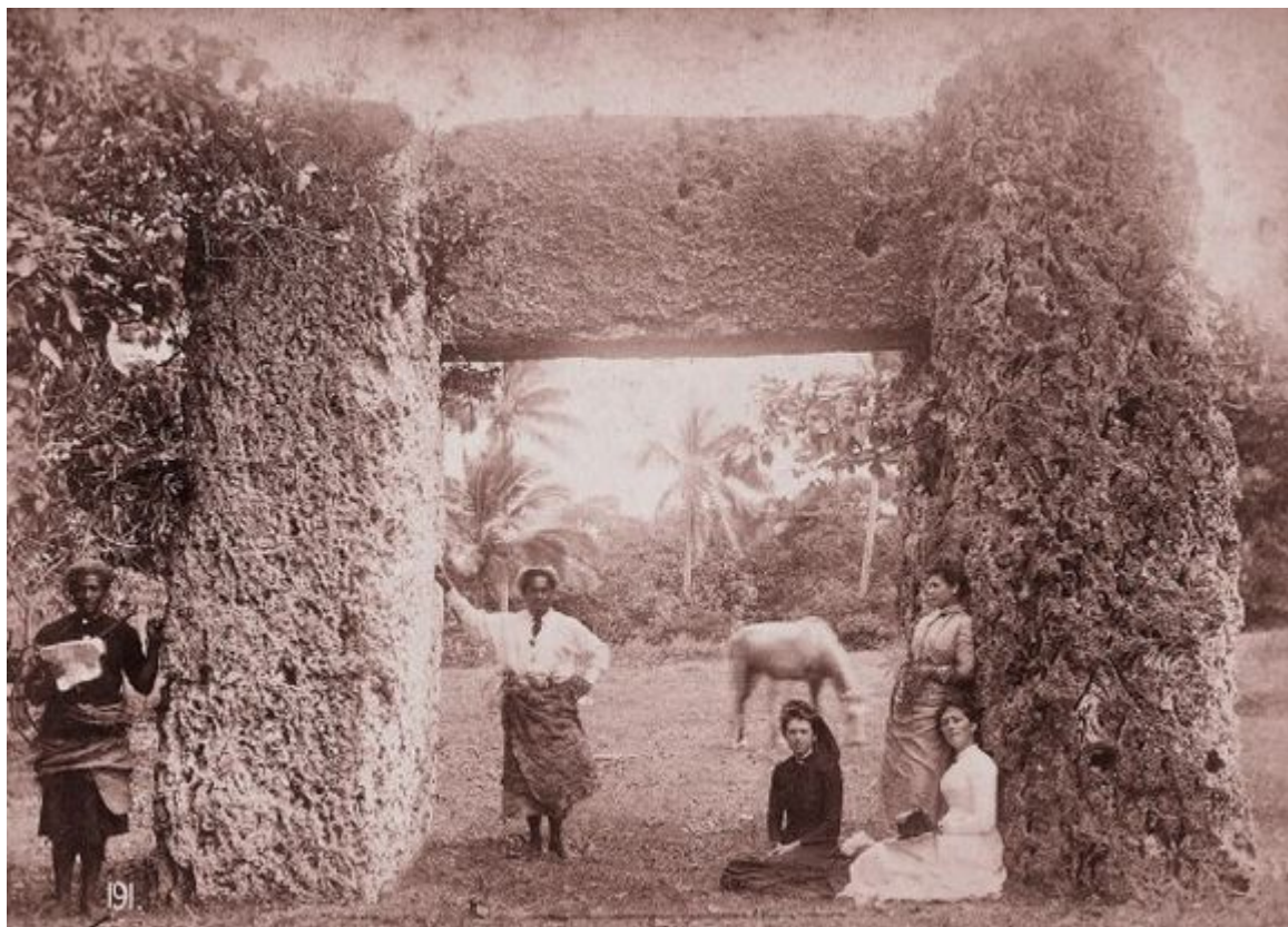
Triliton z korálového vápence na Tonze; kredit: The University of Queensland