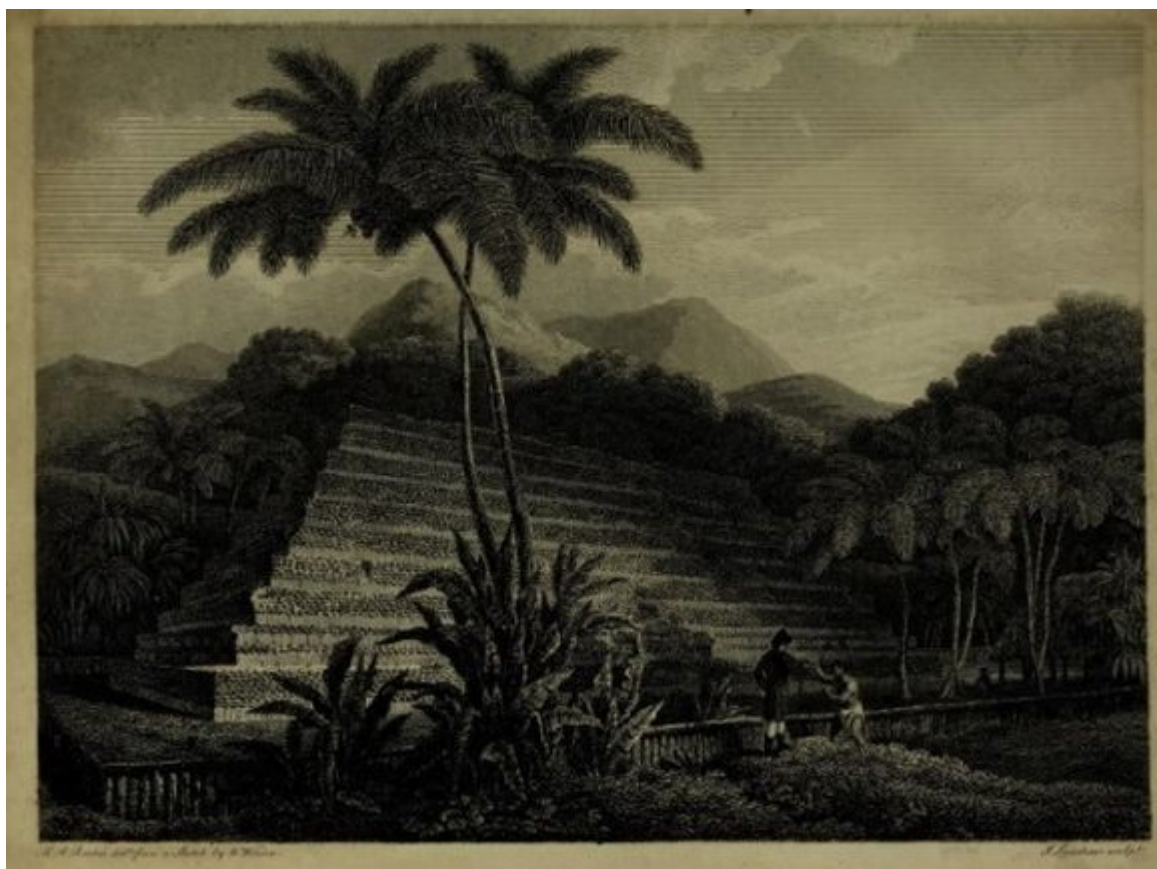
Desetistupňová pyramida z Tahiti, dnes rovněž rozebraná; deset pyramidálních stupňů má odpovídat deseti nebesům polynéské kosmologie. (zdroj)

Peter Buck, jenž tahitskou pyramidu Mahaitea navštívil, píše: