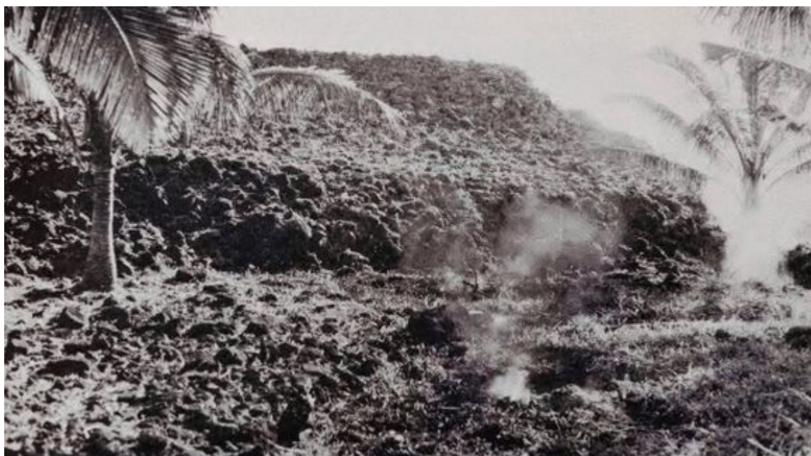
Stupňovitá kamenná mohyla Pulemelei Mound, Západní Samoa.

Na souostroví Samoa byla na konci 60. let objevena díky technologii LIDAR v tropickém pralese stupňovitá kamenná pyramida o obdélném půdorysu 65 x 60 m a výšce 12 m.