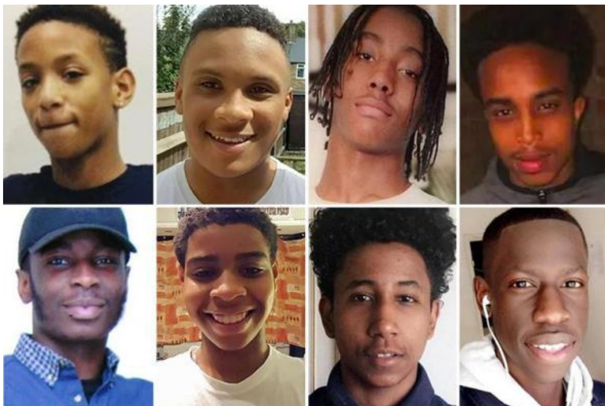
Zbraně nezabíjejí lidi, zabíjejí je další lidé (zdroj: The Sun , 21. listopadu 2017)

Pokud zakážeme nože, budou mít nože jedině zločinci - což by mohlo osvětlit dnes běžné zprávy jako například tato, které zní podobně jako víkendové kriminální zpravodajství z Chicaga. Stačí si jen místo „střelby“ dosadit „pobodání“.