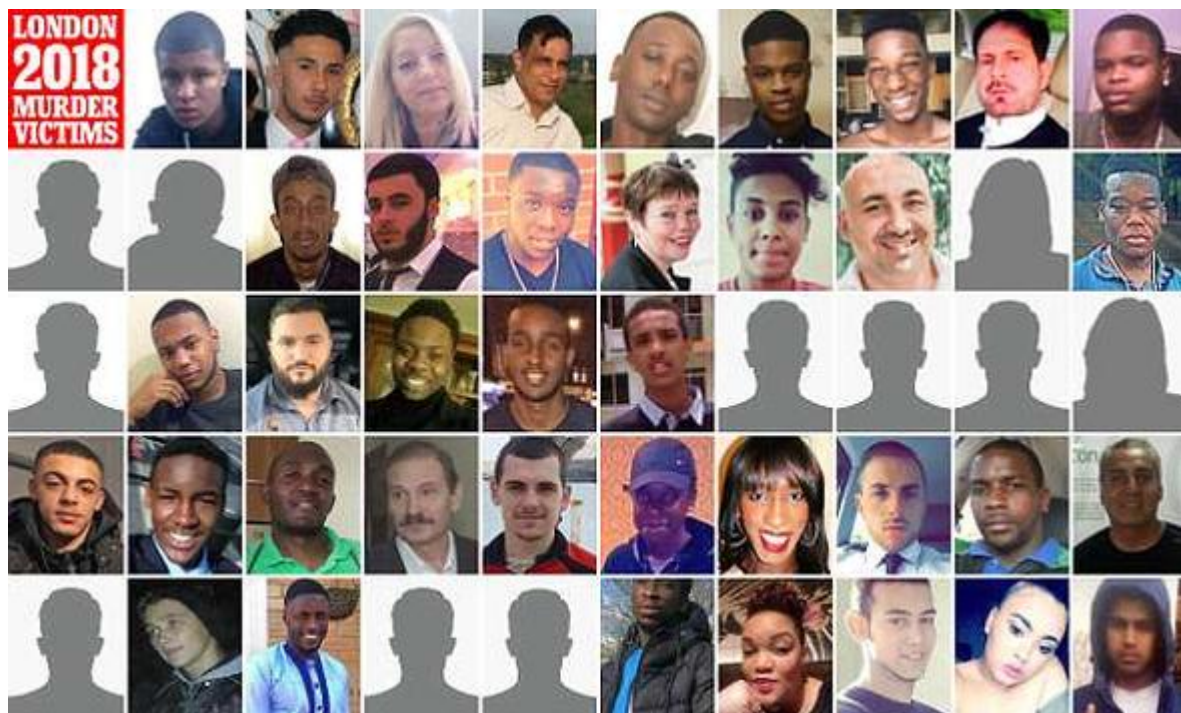
Zbraně nezabíjejí lidi, zabíjejí je další lidé (zdroj: The Daily Mail , 4. dubna 2018)