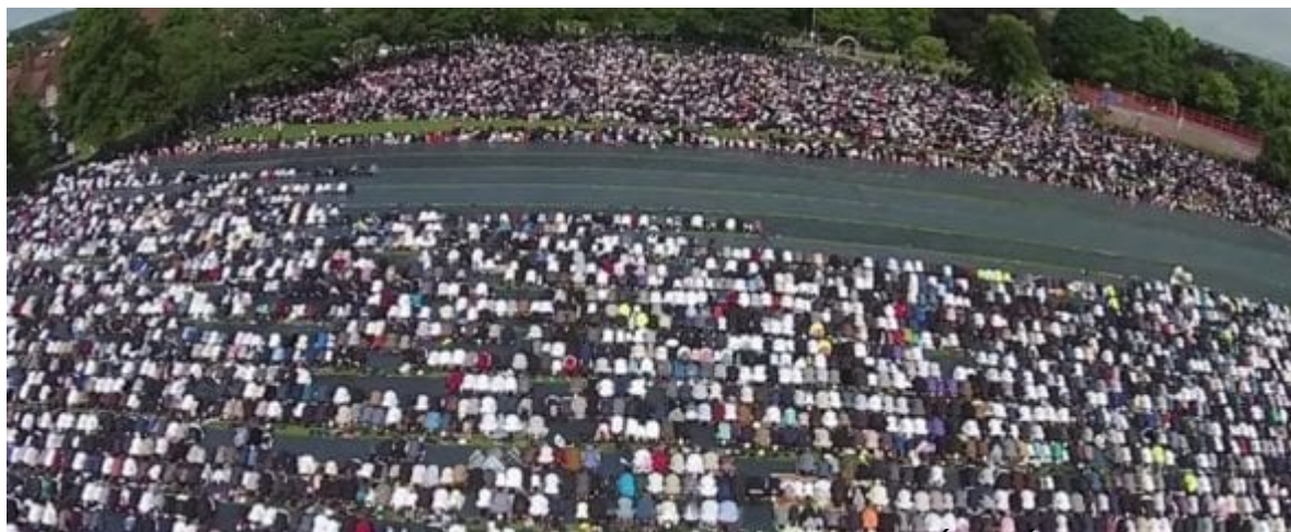
Muslimové v Birminghamu při modlitbě prvního Ídu (Id al-fitr, konec ramadánu, 6. července 2016. Video zde )

Demograficky Británie dostává stále islámštější podobu, hlavně ve městech jako Birmingham, Bradford, Derby, Dewsbury, Leeds, Leicester, Liverpool, Luton, Manchester, Sheffield, Waltham Forest a Tower Hamlets.