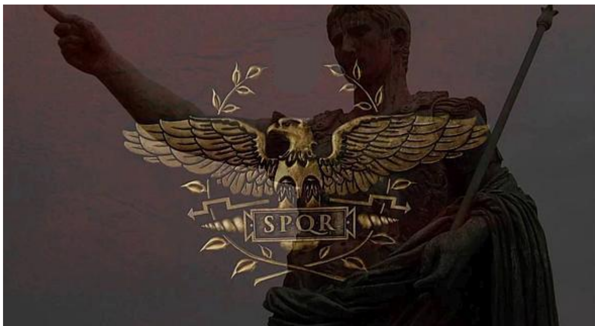
Caesar: Voják, Tvůrce, Autokrat

15. března, před více jak dvěma tisíci lety, byl v Římě, na místě, kde je nyní Corso Vittorio Emanuele, jedna z nejživějších tříd, ubodán mnohačetnými ranami spikleneckých dýk Gaius Julius Caesar.