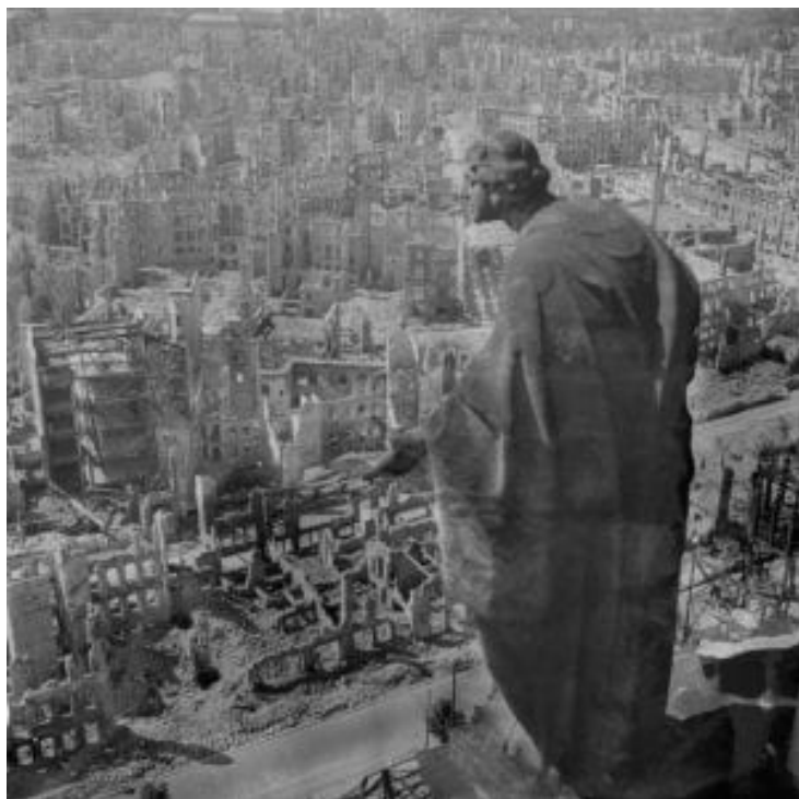
Drážďany, 1945 (socha Augusta Schreitmüllera Güte /Bonitas/ shlíží na město po náletu)