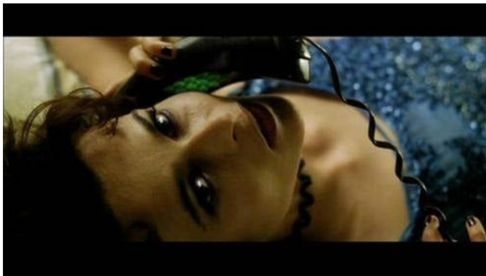
Helena Bonham Carterová jako Marla Singerová

Zásadním důvodem zavržení výkladu Klubu rváčů coby „gay“ díla je i ústřední úloha postavy, o níž jsem se dosud nezmínil: Marly Singerové.