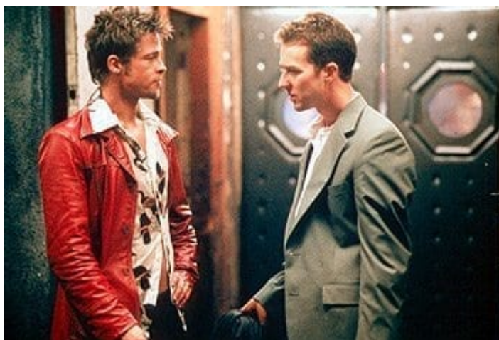
Tyler s Jackem resuscitují dějiny