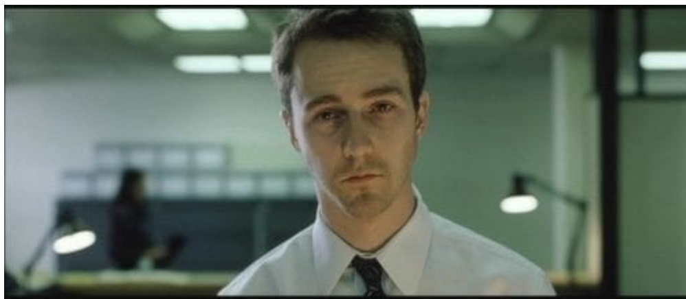
Edward Norton jako „Jack“

Náš přítel Jack je Poslední člověk . Pracuje jako „koordinátor pro stažení výrobků z trhu“ velké nejmenované automobilky a žije „americký sen.“ Když nepracuje, tráví čas vybavováním svého klimatizovaného bytu v luxusní betonové bytovce (v delawarském Wilmingtonu – což ale film jen lehce naznačuje) nábytkem z IKEA, přehozy a dekorativními dekami. Má všechno: košile od CK, boty DKNY a kravaty AX. A vůbec nic jiného. Kdyby film (nebo kniha) vznikly o něco později, velkou část Jackových večerů a volných dní by jistě vyplňovalo sledování online pornografie a masturbace. (Omlouvám se, pánové. Snad jsem neřal příliš do živého?)