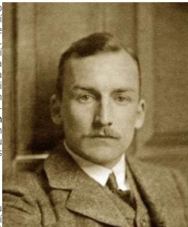
John Frederick Charles „Boney“ Fuller (1 . 9. 1878 - 10. 2. 1966)

Roku 1897 začal Fuller studovat na Royal Military College a následujícího roku byl odeslán do posádkové služby v Irsku. I když měl rád šerm i střelbu, nepřilnul mladý voják k společenské zábavě důstojnických kruhů. Zatímco jeho spolužáci vyjížděli na lov se psy, Fuller v samotě své studovny četl – ze všech věcí – zrovna filozofii. Jeden z jeho spolužáků poznamenal, že Fullerova konverzační zdatnost a kousavý smysl pro humor často „vyvolával v kantýně naprostý zmatek a nechápavé pohledy.“ Už od samého počátku tak byl, jak sám řekl, „tím nejnetradičnějším vojákem.“