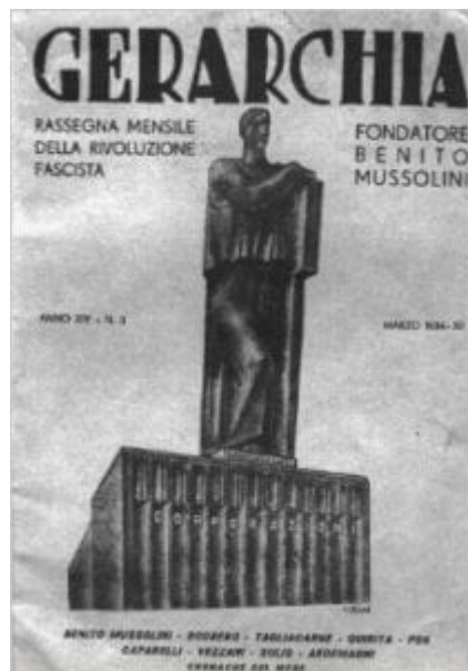
Gerarchia, Rassegna Mensile della Rivoluzione Fascista

Proti tomu fašista nehledí na majetek jako na nejvyšší vlastní dobro, nýbrž jako na prostředek – nástroj – pomocí něhož získává práci a obživu on i jeho bližní a proto také dobytí a užívání majetku přináší fašismu s sebou mnoho povinností a zodpovědnosti. Fašismus si velmi dobře uvědomuje, že lidi nelze posuzovat jen podle hmotného bohatství nebo chudoby, ale také podle jejich duševních a mravních hodnot. A hrdinské pojetí života, k němuž fašismus míří, netkví v honbě za vzrušením a hazardní hře se životem, nýbrž ve vnitřní rovnováze, která ho chrání a posiluje v kolísání mezi propastmi a horami života ve společnosti.