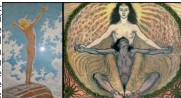
Obrazy Fiduse (vlastním jménem Hugo Reinhold Karl Johann Höppener), německého malíře, jehož dílo ovlivnilo pozdější psychedelické designerské styly.