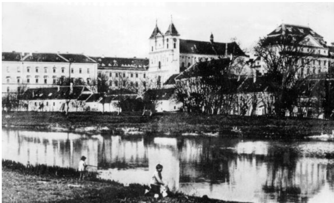
Klosterbruck na počátku minulého století