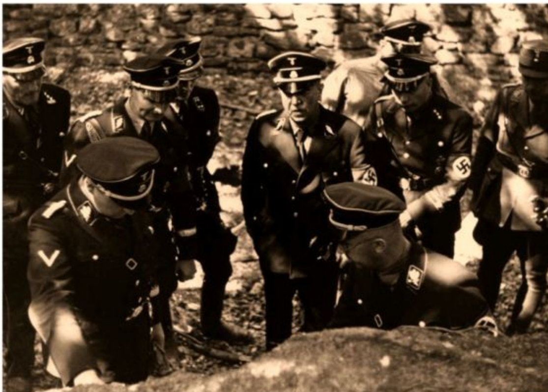
Karl Maria Wiligut (uprostřed) na vrcholu vlivu...