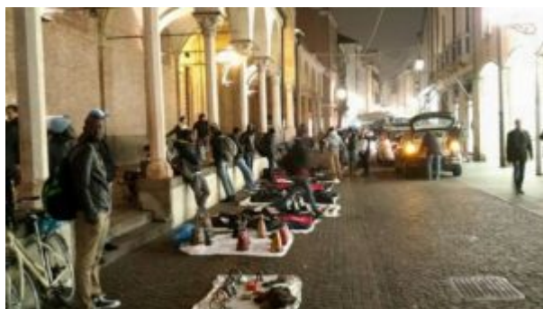
„vu cumprà“ v Padově

Teď (zdánlivě) odjinud: Franco Freda, dlouholetý politický vězeň systému, krátce po svém propuštění, někdy v roce 1987, spatřil v novinách první fotku skupiny afrických pouličních prodejců ve stínu „nebeských mečů“ věží milánské katedrály. „Buď je to fotomontáž, nebo nepřístojnost,“ pomyslel si prý tehdy. Konfrontován s první silnou vlnou barevných přistěhovalců, nedopřál si z předchozího „politického léčení“ ani dva roky odpočinku a po celé Itálii začal vytvářet Národní frontu. Za což strávil v cele dalších pět let a v roce 2000 pak „pandemopluto“ ministerská rada frontu definitivně rozpustila pro narušení (protirasistické) legislativy. Co na tom, že na začátku nového tisíciletí některé její programové body přešly i parlamentní strany, že některá navrhovaná opatření byla pak dokonce uzákoněna? - beztak není „politická vůle“ je vymáhat. Itálie tak dále černá, tmavne, a to nikoli metaforicky - „vu cumprà“ (z it. vuoi comprare - chceš koupit) již ke „koloritu“ jejích náměstí a ulic patří „neodmyslitelně“. Pro generaci narozenou v devadesátých letech to nejspíš bude už „normálka“. Ve své soudní obhajobě Freda mj. připomíná, jak liberasti takřka monomanicky opakují: „Rasista má strach.“ Načež on svým stoupencům říkal: „Nebojte se bát, protože je čeho se bát!“ ( L'albero e le radici. Il processo criminale alle idee del Fronte Nazionale , 1996).