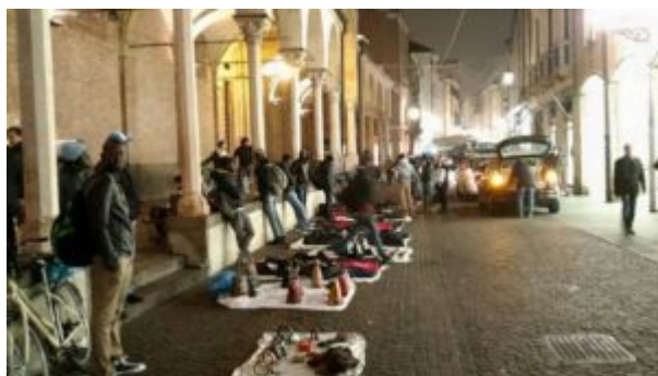
„vu cumprà“ v Padově

Ted' (zdánlivě) odjinud: Franco Freda, dlouholetý politický vězeň systému, krátce po svém propuštění, někdy v roce 1987, spatřil v novinách první fotku skupiny afrických pouličních prodejců ve stínu „nebeských mečů“ věží milánské katedrály. „Buď je to fotomontáž, nebo nepřístojnost,“ pomyslel si prý tehdy. Konfrontován s první silnou vlnou barevných přistěhovalců, nedopřál si z předchozího „politického léčení“ ani dva roky odpočinku a po celé Itálii začal vytvářet Národní frontu. Za což strávil v cele dalších pět let a v roce 2000 pak „pandemopluto“ ministerská rada frontu definitivně rozpustila pro narušení (protirasistické) legislativy. Co na tom, že na začátku nového tisíciletí některé její programové body přešly i parlamentní strany, že některá navrhovaná opatření byla pak dokonce uzákoněna? - beztak není „politická vůle“ je vymáhat. Itálie tak dále černá, tmavne, a to nikoli metaforicky - „vu cumprà“ (z it. vuoi comprare - chceš koupit) již ke „koloritu“ jejích náměstí a ulic patří „neodmyslitelně“. Pro generaci narozenou v devadesátých letech to nejspíš bude už „normálka“. Ve své soudní obhajobě Freda mj. připomíná, jak liberasti takřka monomanicky opakují: „Rasista má strach.“ Načež on svým stoupencům říkal: „Nebojte se bát, protože je čeho se bát!“ ( L'albero e le radici. Il processo criminale alle idee del Fronte Nazionale , 1996).