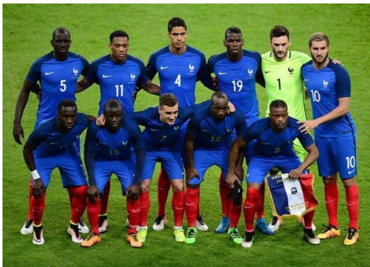
Francouzská fotbalová reprezentace

Kdyby se tedy Ernstu Jüngerovi nenabídla možnost jít do války, zjevně by byl sportovcem – pak by ovšem nebyl Ernstem Jüngerem, protože jeho metafyzickou transcendenci by nahradila náhražková sláva reklamy na Nike. Sport (zejména ten týmový) nejen že napodobuje válku, vyžaduje také podobné ctnosti jako ona – sílu, kázeň, tvrdou dřinu, čest, sebeobětování, solidaritu – i když pravda bez s ní spojených rizik. Tým je tedy náhradou za kmenovou skupinu válečníků. Tým zastupuje svůj národ a národ je zastoupen svým týmem.