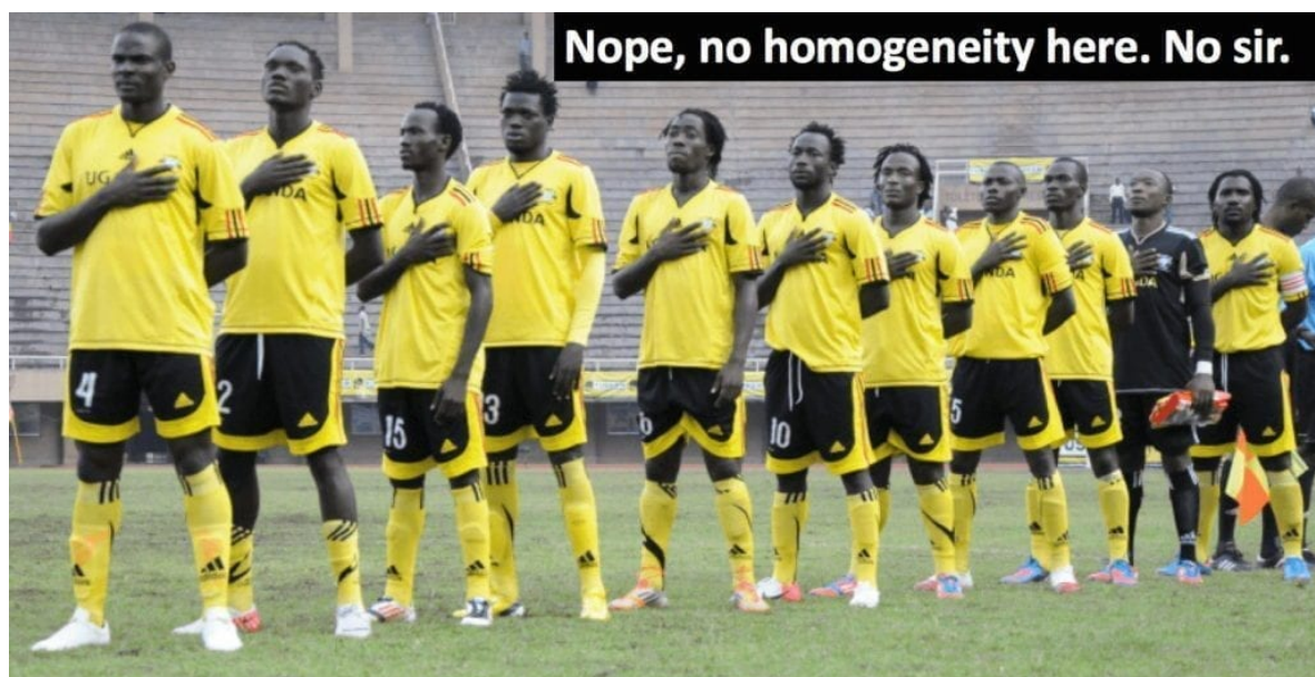
Ugandská fotbalová reprezentace.