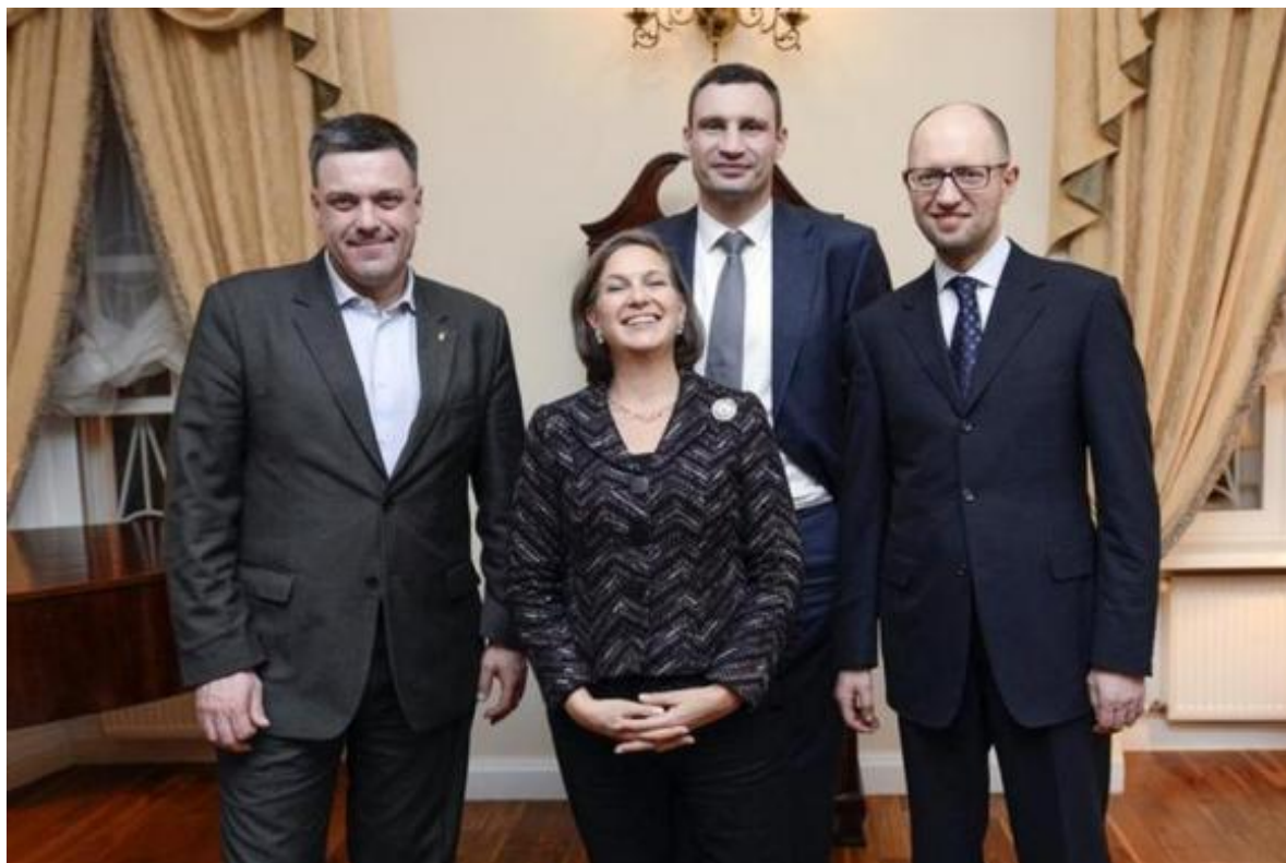
Jeden z hlavních autorů Národního manifestu, ukrajinský „nacionalista“ Oleg Ťahnybok a Victoria „Fuck the EU!“ Nuľand.