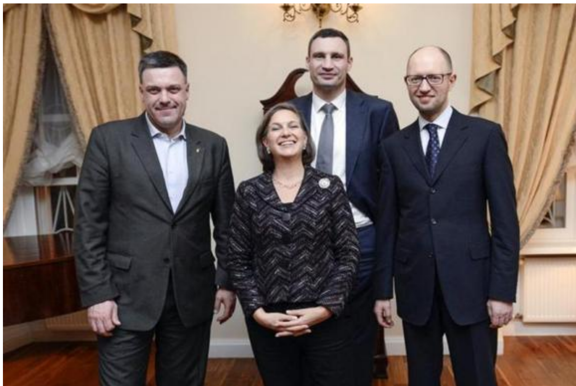
Jeden z hlavních autorů Národního manifestu, ukrajinský „nacionalista“ Oleg Tahnybok a Victoria „Fuck the EU!“ Nuľand.