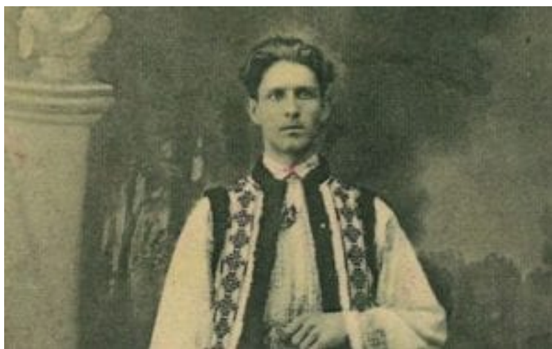
Corneliu Codreanu (1899-1938), zakladatel a vůdce Legie archanděla Michaela, také známé jako rumunská „Železná garda.“

Při příležitosti Codreanuových nedožitých 117. narozenin přinášíme našim čtenářům jeho postřehy k demokracii v její moderní, liberální podobě. Redakce DP