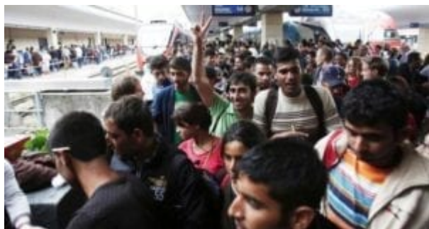
Danke Mutti Merkel!

Nejnovější analýzy vycházející z oficiálních údajů německých statistiků ukazují, že nekončící invaze Třetího světa do Německa během pouhých čtyř let vytvoří barevnou většinu ve věkové skupině mezi 20 a 30 lety a neevropskou většinu v rámci celé společnosti během jediné generace.