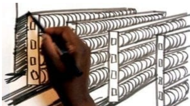
For Cultural Purposes Only (2009)