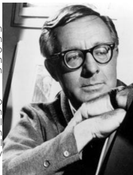
Ray Bradbury (1966)

Z podobné zkoušky ohněm se dříve rodili velcí spisovatelé. Autora tvořil rovný díl inspirace, odhodlání a ochota riskovat vše v naději - často hraničí s šílenstvím - že se i někomu jinému bude líbit to, co píše. V Americe dneška se člověk, který se rozhodne stát spisovatelem, obvykle zapíše do vysokoškolských kurzů tvůrčího psaní a následně - pokud mu nechybí ambice - pokračuje doktorským studiem a titulem, po němž jej čekají nekonečné „workshopy“, kde se učitelé nenadaní brilantním talentem pokouší naučit potenciální