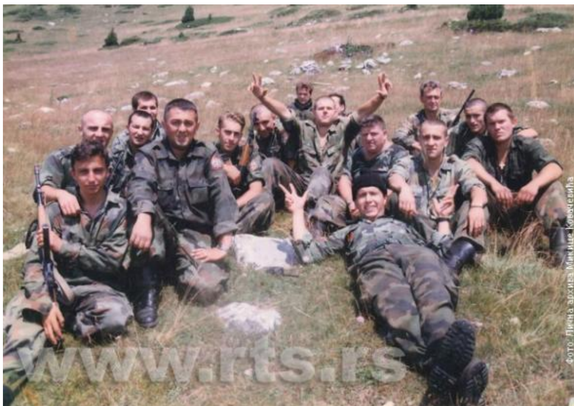
Hrdinové z Košare

Na den před 19 lety napadly síly takzvané „Kosovské osvobozené armády“ (UÇK), albánské armády a NATO předsunutou jugoslávskou základnu Košare na albánsko-jugoslávských hranicích.