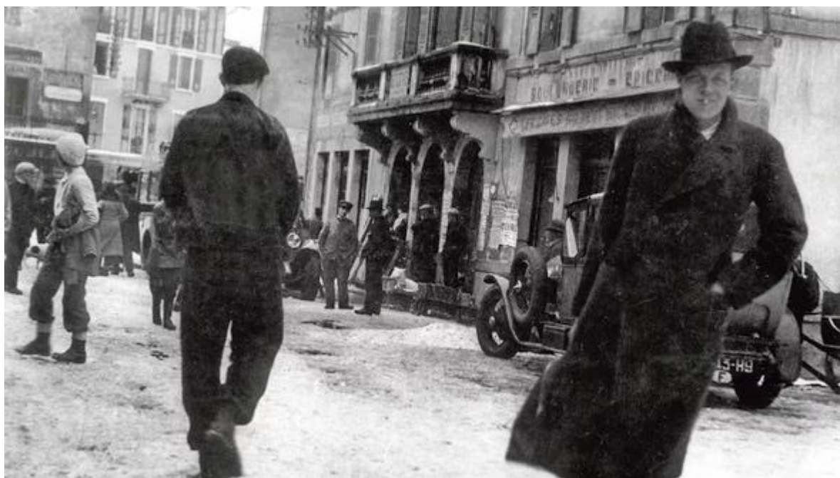
Pierre Drieu la Rochelle v sychravé Paříži...