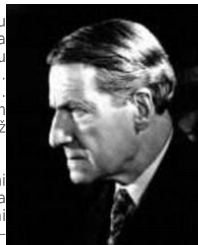
rabín Stephen Wise

Oplýval právníkou verbální sofistikou a přetékal nejnovějšími liberálními frázemi o žádoucnosti „míru bez vítězství“, „světa bezpečného pro demokracii“, ale zřejmě neměl ani zájem, ani povědomí o realitě situace, k níž se mělo jeho Čtrnáct bodů – stejně jako „Čtyři zásady“ z 11. února 1918, „Čtyři cíle“ (4. července 1918) a „Pět detailů“ (27. září 1918) – údajně vztahovat.