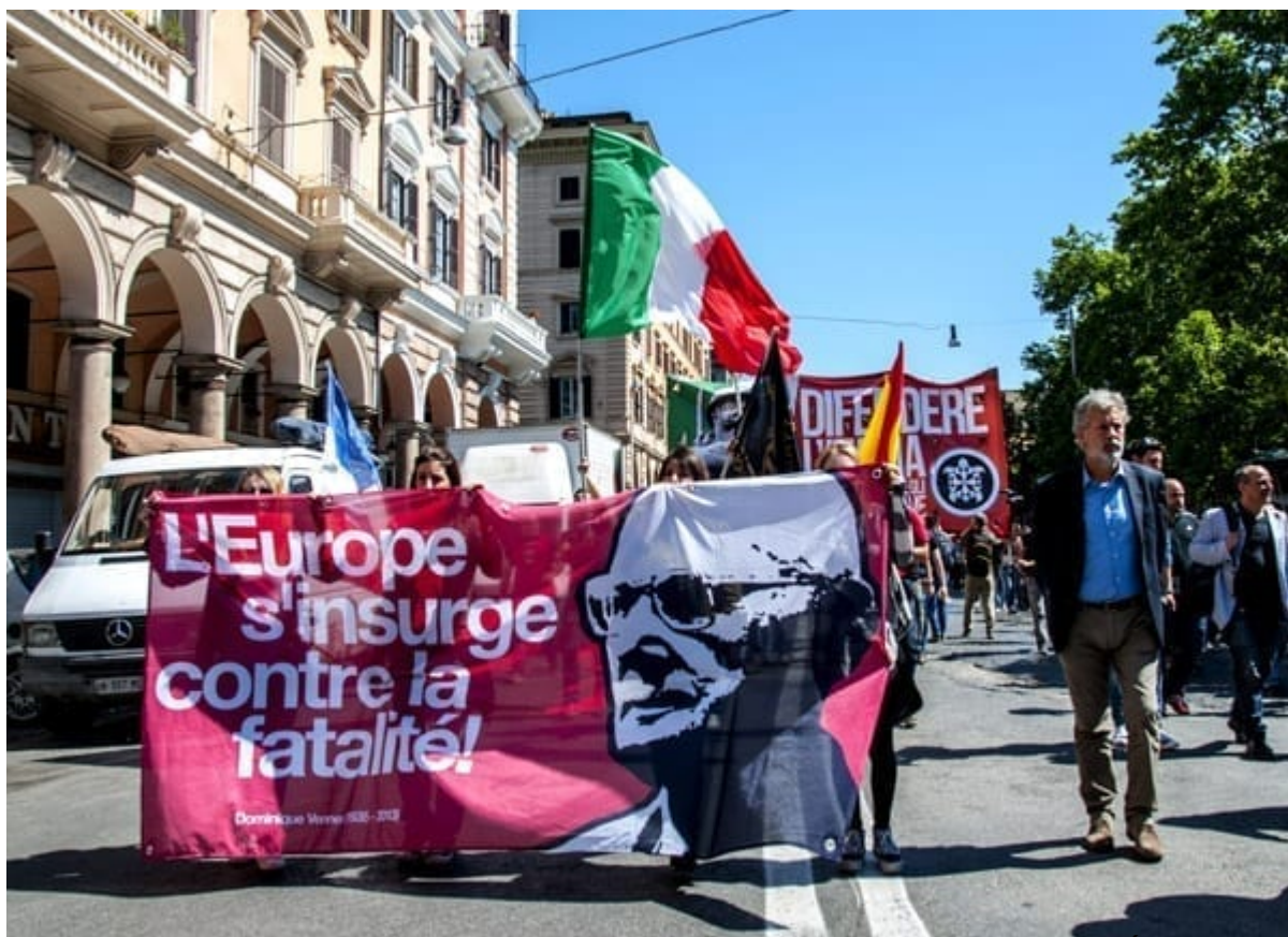
Průvod Casa Pound k uctění památky Dominique Vennera. Účastníci cestou na místo akce rozvinuli vlajky Itálie, Francie, Španělska a řeckého hnutí Zlatý úsvit.