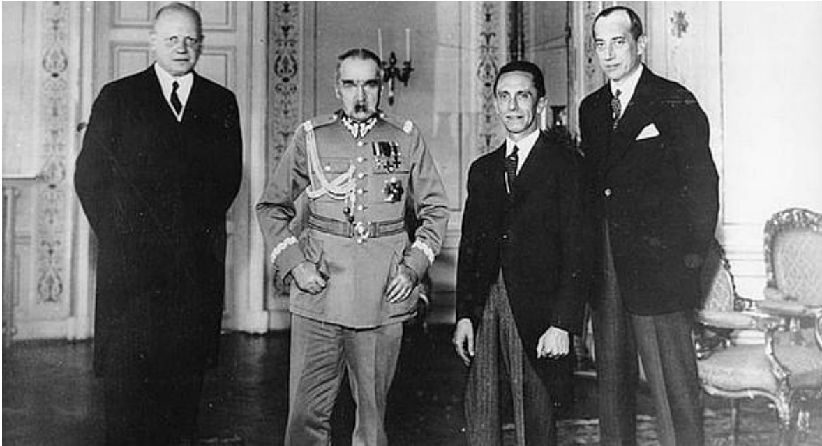
Rusko se postavilo zpochybňování jeho podílu na vítězství Spojenců v druhé světové válce (ilustrační foto: Německý velvyslanec Hans-Adolf von Moltke a německý ministr propagandy Joseph Goebbels na návštěvě u polského maršála Józefa Piłsudského /napravo polský ministr zahraničních věcí Józef Beck/ ve Varšavě 15. června 1934. )