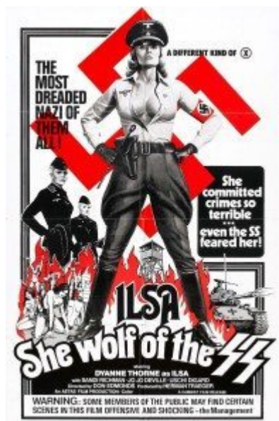
A different kind of X

Do jejich „akčního“ repertoáru mj. patří vynucovaný a pozorně sledovaný sex vězeňkyň s válečnými mrzáky či duševně postiženými, puntičkářsky vykonávané tělesné tresty za sebemenší přestupky proti „pořádku“, masová znásilňování i hromadné exekuce, kdy pod dávkami z kulometů a samopalů „mrtví umějí tančit“ 5] apod. Tyto „SS-happeniny“ se přitom zpravidla odehrávají v posledních měsících války, v přísně uzavřeném, totálně kontrolovaném areálu „vyhlazovacího tábora“ s nevlídnými komorami i rafinovanými „experimentálními laboratořemi“. Nebudeme se touto pokleslou „camp“ (v pravém slova smyslu) produkcí dále podrobněji zabývat, podivíni, které z nějakého důvodu přitahuje, se s ní ostatně mohli seznámit na DVD discích firmy Ritka video s. r. o. ( nomen omen? ), která před časem několik těchto titulů přeložila a distribuovala. 6] Přejdeme raději k vrcholnému dílu muže, který se těší pověsti jednoho z nejvýznamnějších umělců poválečné Itálie.