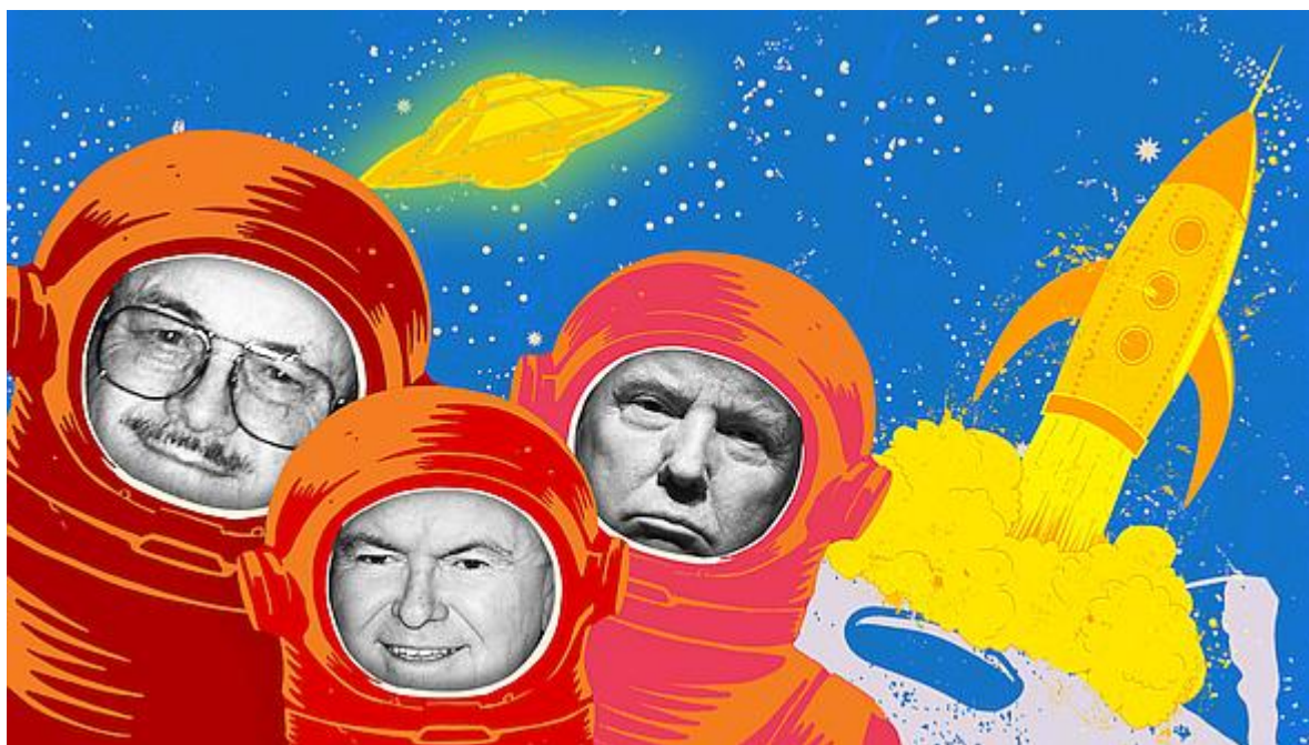
Sci-fi inspirace krajní pravice: od Jerryho „Luciferova kladiva“ přes Newtovu základnu na Měsíci až k Donaldově zdi