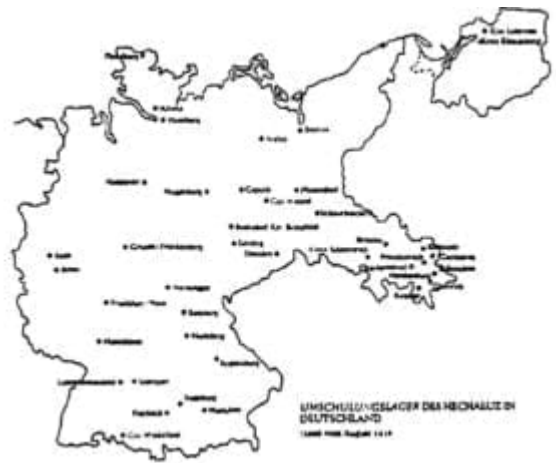
Mapa sítě asi 40 táborů a zemědělských center sionistické mládežnické organizace he-Chaluc v Německu.

Himmlerova bezpečnostní služba také spolupracovala s Haganou, sionistickou podzemní vojenskou organizací v Palestině. Úřad SS platil jednomu z jejích představitelů Feivelu Polkesovi za informace o situaci v Palestině a pomoc při soustředění židovské emigrace do země. Haganou měla spolehlivé zprávy o německých plánech díky špehovi, kterého se jí podařilo získat na berlínském velitelství SS. [20] Spolupráce SS s Haganou dospěla dokonce až k tajným dodávkám německých zbraní židovským osadníkům pro střety s palestinskými Araby. [21]