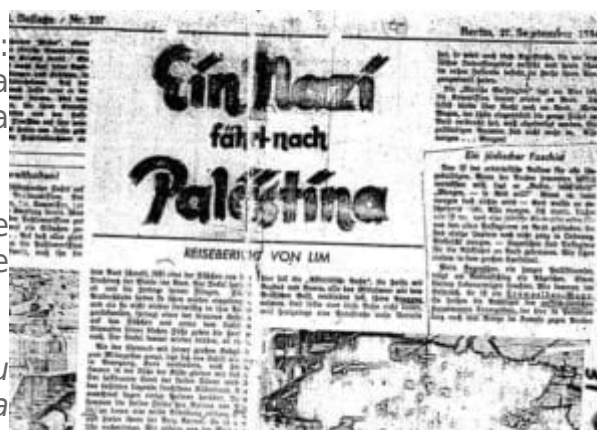
Ukázka von Mildensteinovy reportáže Ein Nazi fährt nach Palästina, která vycházela na pokračování v berlínských novinách

O čtyři měsíce později se podobný článek objevil i