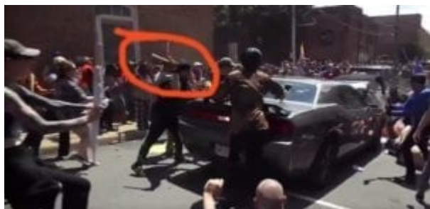
Mírumilovná protidemonstrace za rovnost a rasovou snášenlivost.

Kolem tři čtvrtě na dvě toho dne se stal dvacetiletý James Fields, který do Charlottesville přijel kvůli Unite the Right, účastníkem srážky aut, při níž zemřela žena, a 19 dalších lidí bylo zraněno. Podle dostupných videozáznamů události Fields projížděl ulicemi města normální rychlostí, když na jeho auto podle všeho zaútočili levicoví demonstranti. Zřejmě ze strachu o svou bezpečnost šlápl Fields na plyn a narazil do auta před sebou. Další video pak jasně ukazuje, jak se na jeho vůz zezadu řítí vlna násilníků, Fields řadí zpátečku a z místa ujíždí. Fields byl obžalován z vraždy druhého stupně. Levicový i pravicový lynčující dav zástupců establishmentu samozřejmě zcela odvrhl zásadu presumpce nevinny a Fields byl tak označen za „teroristu“ , o němž se mluví jako o „Jamesi Alexi Fieldsovi“ - jako by to byl druhý Lee Harvey Oswald.