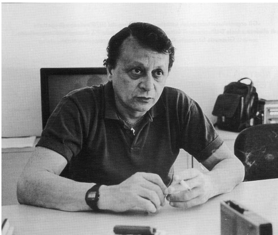
Stefano Delle Chiaie (13. září 1936 – 9. září 2019)

stranickostí tisku s jeho bezohledným cynismem i bezmyšlenkovitou lhostejností, záhy pronikl do odborných prací o politickém extremismu a udržuje se v něm dodnes, třebaže po několika soudních procesech, z nichž „římský bombardák“ nakonec vyšel s osvobozujícím rozsudkem, jeho (krvavé) barvy i (černé) tahy značně vybledly. Nicméně na wiki nálepka „ black “ či „neofascist terrorist“ drží přepevně a pro orientaci lidiček v ustavené soustavě to postačuje. Naše črta bude podstatně střízlivější, věcnější, až na závěr její monochrom bez tajemství zabarvíme delší osobní vzpomínkou portrétovaného.