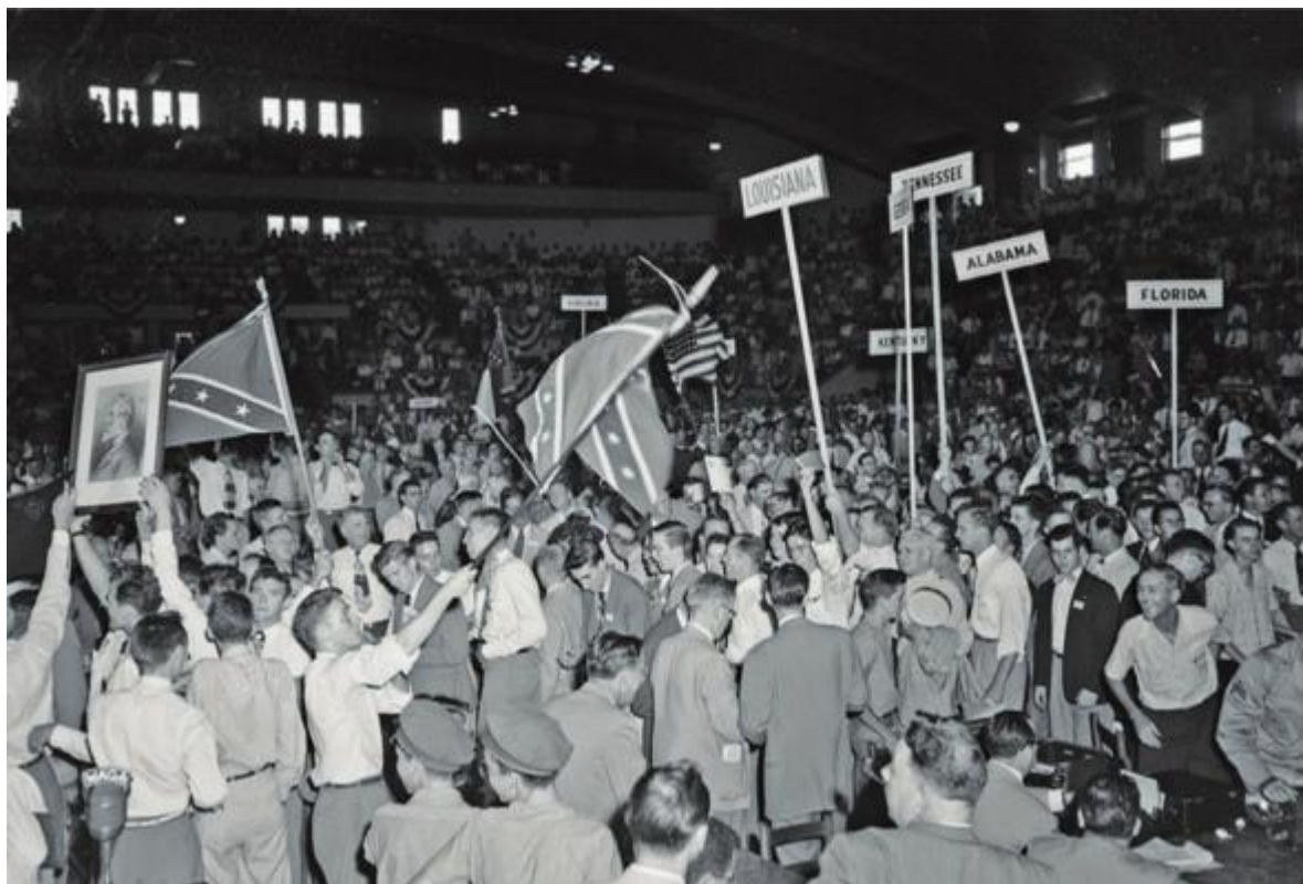
Sjezd Demokratické strany práv států (přezdívané „Dixiecrats“) v roce 1948