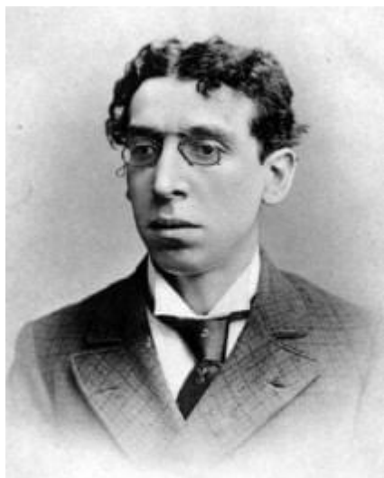
Israel Zangwill, kulturní sionista a blízký spolupracovník Theodora Herzla. Autor divadelní hry The Melting Pot (1908)