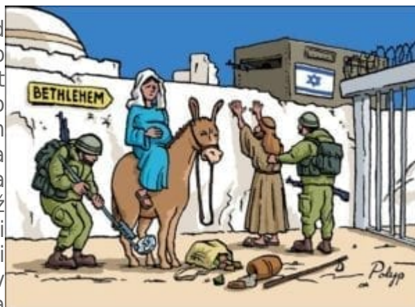
Tak by to asi vypadalo dnes..

První, Ježíš byl židovský odpadlík a nikdo nemá rád odpadlíky. Druhý, Ježíš odmítl judaismus pro jeho tribalismus, nelidskost a intelektuální nepoctivost a tato pravda bolí, proto Židé nenávidí Ježíše jako posla špatných zpráv. Třetí, ačkoli je dnes islám vůči Židům nejodolnějším náboženstvím – a křesťanství nejvíce trapně apologetické a podrobující se – tato skutečnost je problémem až od doby, kdy byl založen stát Izrael. Do té doby žili Židé v muslimských zemích v bezpečí, zatímco byli vyhnáni prakticky z každé křesťanské země v Evropě. Pátá kapitola knihy Israela Shahaka Historie a náboženství Židů obsahuje poučné ukázky židovských názorů na Nežidy, včetně srovnání židovských názorů vůči křesťanům a muslimům.