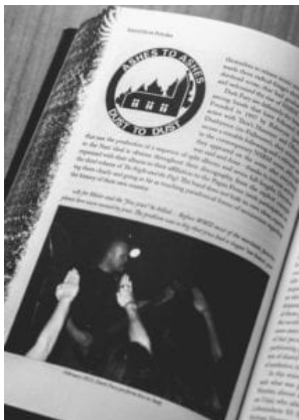
Ukázka z knihy Wolves among Sheep .

v desítkách rozhovorů a prohlášení. „Nebýt dost pravověrný“ už se nerovná jen „pozérství“ – stává se zradou věci, kudlou do zad „kamarádů.“