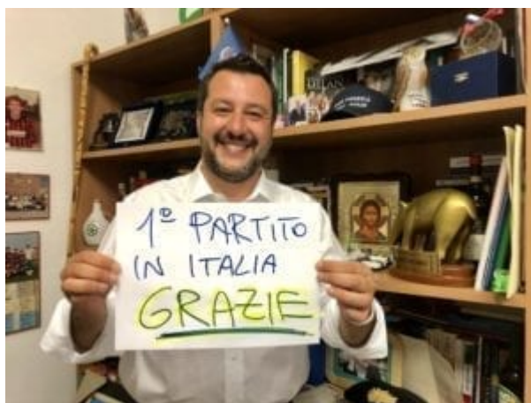
Salvini oslavuje obklopen, jak podotkl jeden komentátor , křesťanskou, trumpovksou a putinovskou symbolikou.