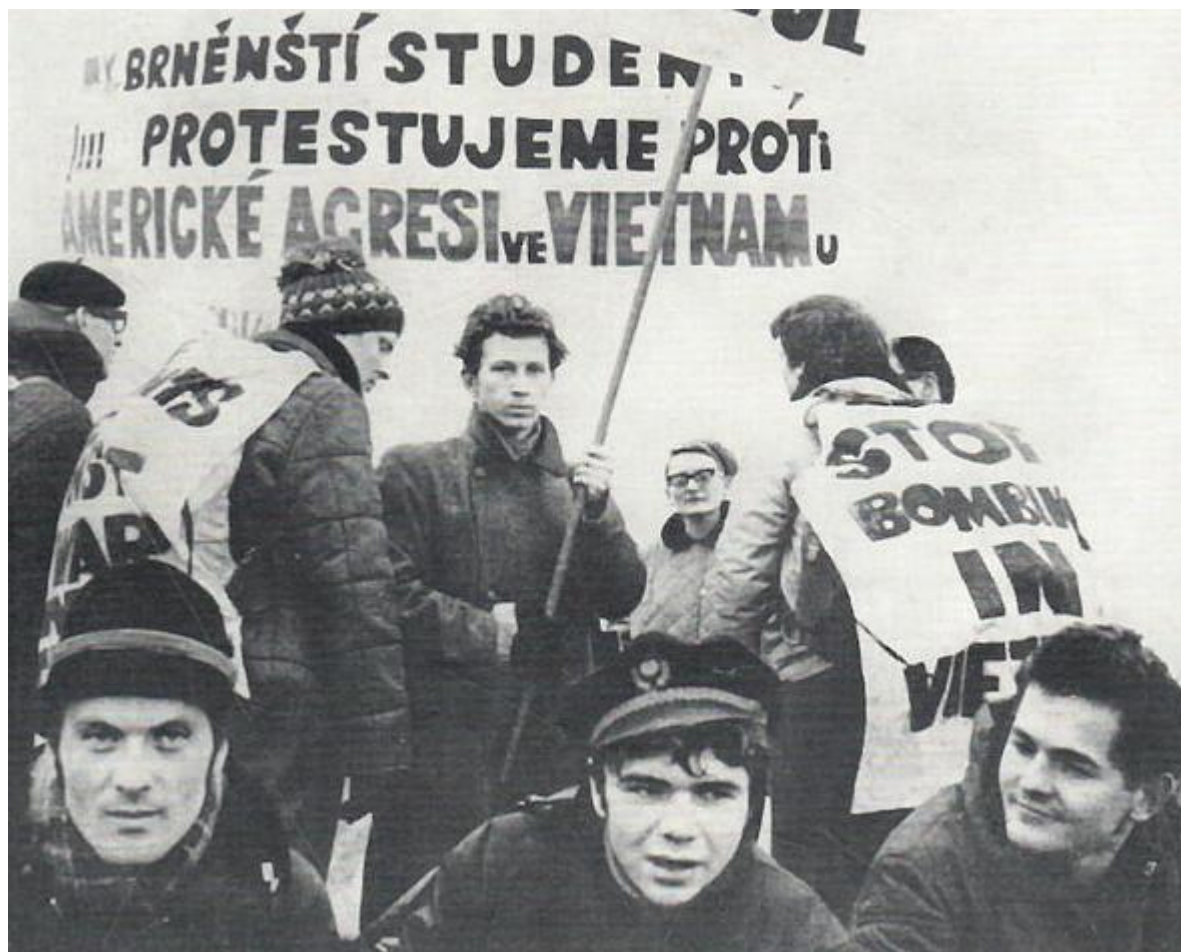
Druhá tvář „osmašedesátého“

Mythus obrození, který vystřídal mythus Masarykovy humánní demokracie, který byl vystřídán mythem protektorátního hrdinství českého odboje, který už nezadržitelně vedl k mythu „socialismu v jedné zemi“, který nezadržitelně vedl k mythu „obrodného procesu 1968“!