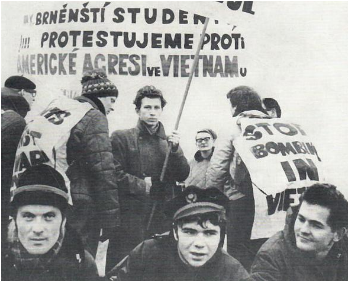
Druhá tvář „osmašedesátého“

Mythus obrození, který vystřídal mythus Masarykovy humánní demokracie, který byl vystřídán mythem protektorátního hrdinství českého odboje, který už nezadržitelně vedl k mythu „socialismu v jedné zemi“, který nezadržitelně vedl k mythu „obrodného procesu 1968“!