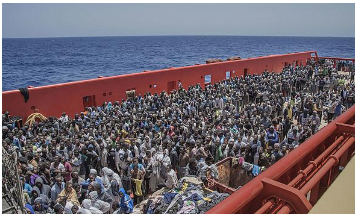
Význam empatie pro morální společenství: altruismus a patologický altruismus