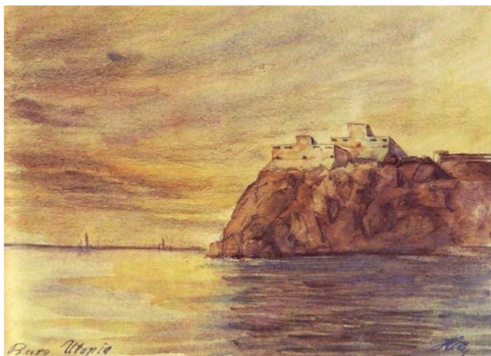
Adolf Hitler - Pevnost Utopie