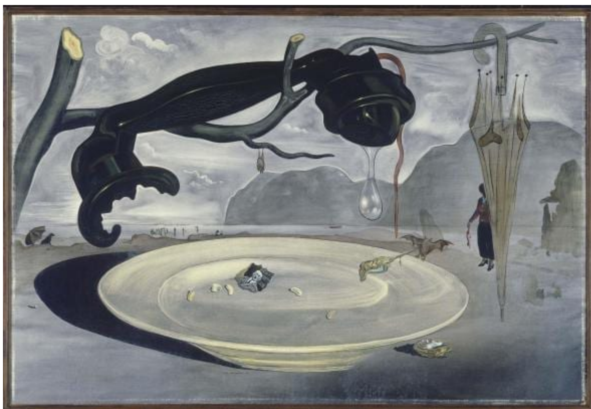
Salvador Dalí - The Enigma of Hitler

dosud tajenku jménem Hitler nevyřešil. Zaujal mě hlavně jako objekt mých šílených vizí a proto, že jsem v něm viděl člověk s jedinečnou schopností obrátit věci úplně naruby.“