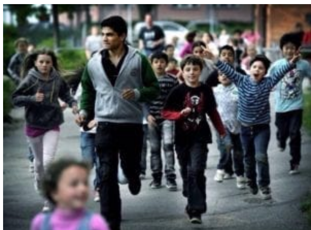
Ctrnáctiletý uprchlický klučina, se svými vrstevníky na základní škole v Kristianstad.

8. Lidé mají slabost pro určité výrazy, jako například „uprchlík“ nebo „dítě“. Nazývejte všechny ekonomické přistěhovalce a žadatele o azyl „uprchlíky,“ bez ohledu na pravdu. Nešťourejte se v žádostech, kdy třicetiletí muži žádají o azyl, vydávající se za děti.