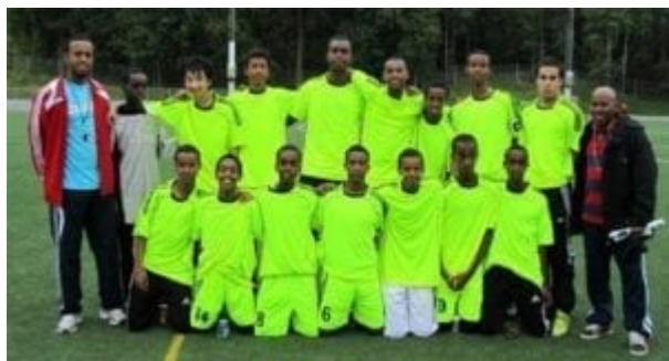
Máme rádi odlišnost

Dále je zde k dispozici video na Youtube (bohužel bez anglických titulků), které mě vede k závěru, že jde o monokulturní školu, jejíž zaměření jde proti všemu, o co usiluje švédská vláda. Nebo je ve skutečnosti doktrína multikulturalismu a diverzity pouze jednostranně zaměřená na Švédy?