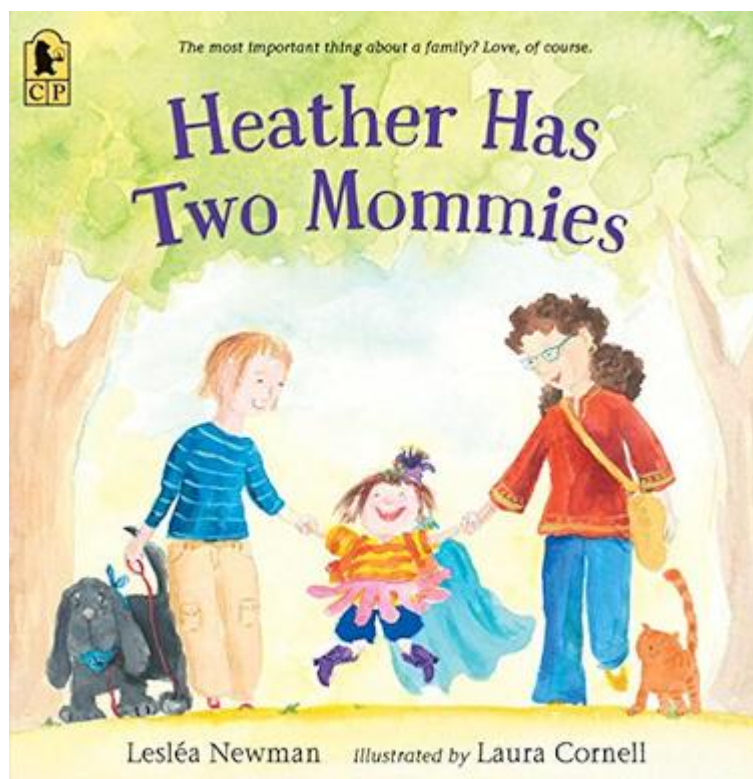
Židovské lesbičky a jejich dílo „Heather a dvě (samozřejmě nežidovské) maminky“