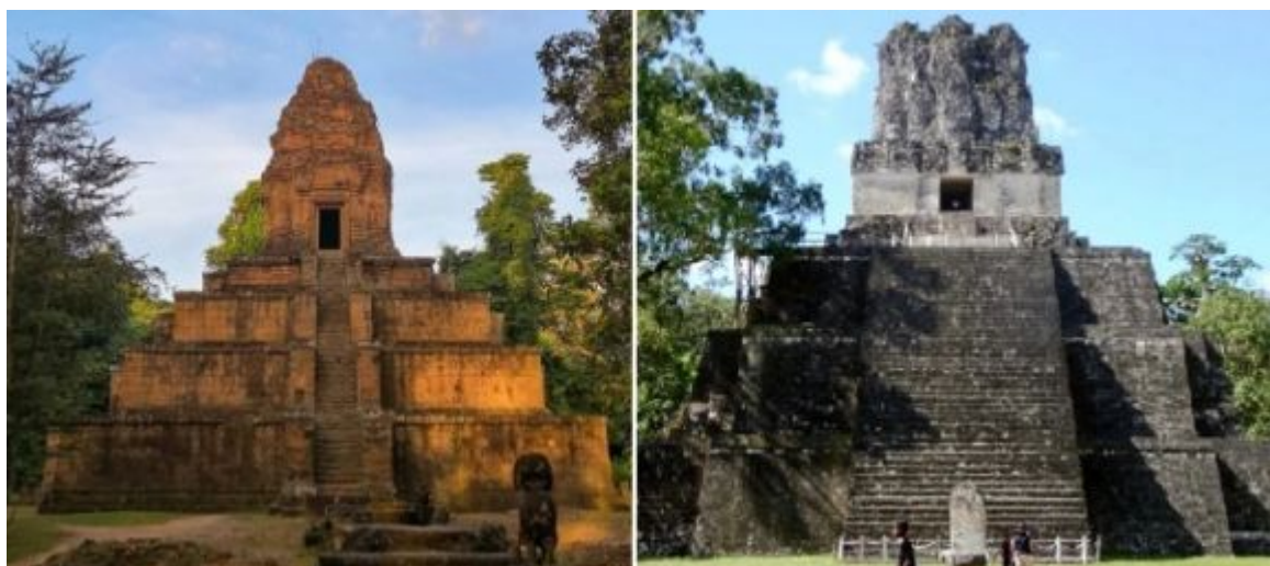
Vlevo šivaistický chrám Baksei Chamkrong v Kambodži (10. století), vpravo májské město Tikal v Guatemale, tzv. Pyramida č. II neboli „Chrám masek“ (rovněž 10. století)