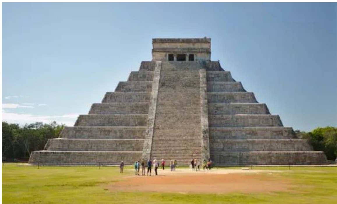
Májská pyramida v Chichén Itzá v Mexiku (pravděpodobně 7. století nebo mladší)