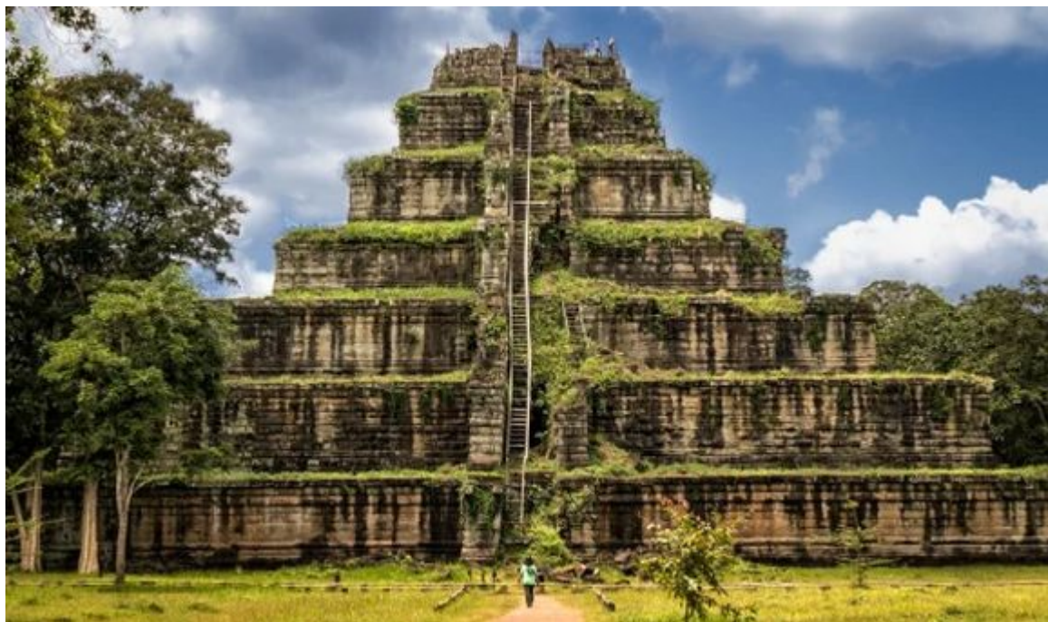
Hinduistický chrám (prasad) Kaôh Ké v Kambodži z období Khmerské říše (10.století)