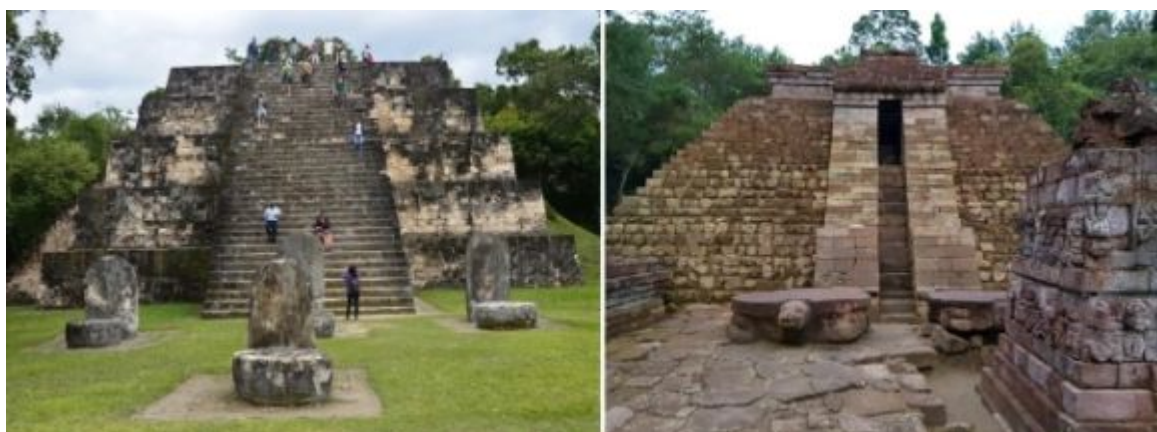
Vlevo májská pyramida v Copánu v Hondurasu (8. století), vpravo hinduistický pyramidální chrám (candi) Sukuh na Jávě z období Madžapahitu (15. století); prapodivných paralel mezi hinduistickým jihovýchodem a předkolumbovským Mexikem jsou desítky; v Copánu se nacházejí též kamenné plastiky želv, které hledí k severu, stejně jako v čínském lidovém náboženství želva symbolizuje sever a v hinduismu ji odpovídá Kúrma avatár