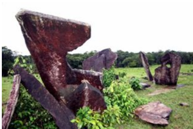
Kamenný kruh v Calçoene

Tropické Stonehenge. V brazilském Calçoene byl prý v pastvině při vysekávání křoví objeven v devatenáctém století zarostlý kamenný kruh, jakési brazilské Stonehenge, popsané archeologickým výzkumem poprvé v roce 2006. Lokalita se nachází v severní špičce Brazílie ve státě Amapá nedaleko hranic Francouzské Guyany. Kamenný kruh v Calçoene sestává ze 127 třímetrových žulových monolitů a má průměr okolo 30 m. Radiokarbonová datace organických zbytků pod kameny předběžně ukazuje na stáří 500 - 2000 let (metoda z principu vždy ukazuje nejnižší zjistitelné stáří, kdy byl kámen naposledy vztyčen, monument může být pochopitelně starší).