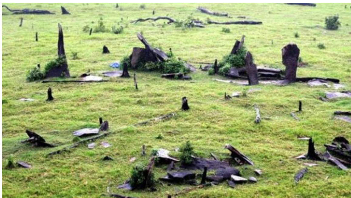
Kamenný kruh v Calçoene

Kuhikugu , „tropický Arkaim“. Hluběji v Amazonii, kde krátce po roce 1541 zmizely celé civilizace, jejichž existenci a zánik Evropané při dobývání Ameriky ani nezaregistrovali, se podobné kamenné monumenty nemohou nacházet z principu – nejsou zde žádné kameny. Amazonskou pánev tvoří devět až deset metrů mocné souvrství naplavenin z And, pouze jíl a písek, a přestože zmizelé amazonské civilizace za sebou zanechaly stovky geoglyfů (šlo podle současných interpretací o zavlažovací kanály, silnice, ohrady, vesnice, valy či sádky) a znaly keramiku i zemědělství, kámen ke stavbě nepoužívaly. A přitom bylo amazonské zemědělství velmi sofistikované, byla zde cíleně zúrodnována půda kompostováním ( terra preta ), zavlažována říčními kanály a byla zde domestikována řada plodin – mimo jiné brazilský paraořech, škrobnaté banány, maniok a místní druhy rýže.