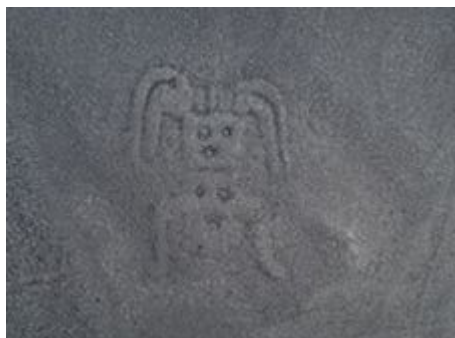
Figurální motiv z „nové“ planiny Nazca