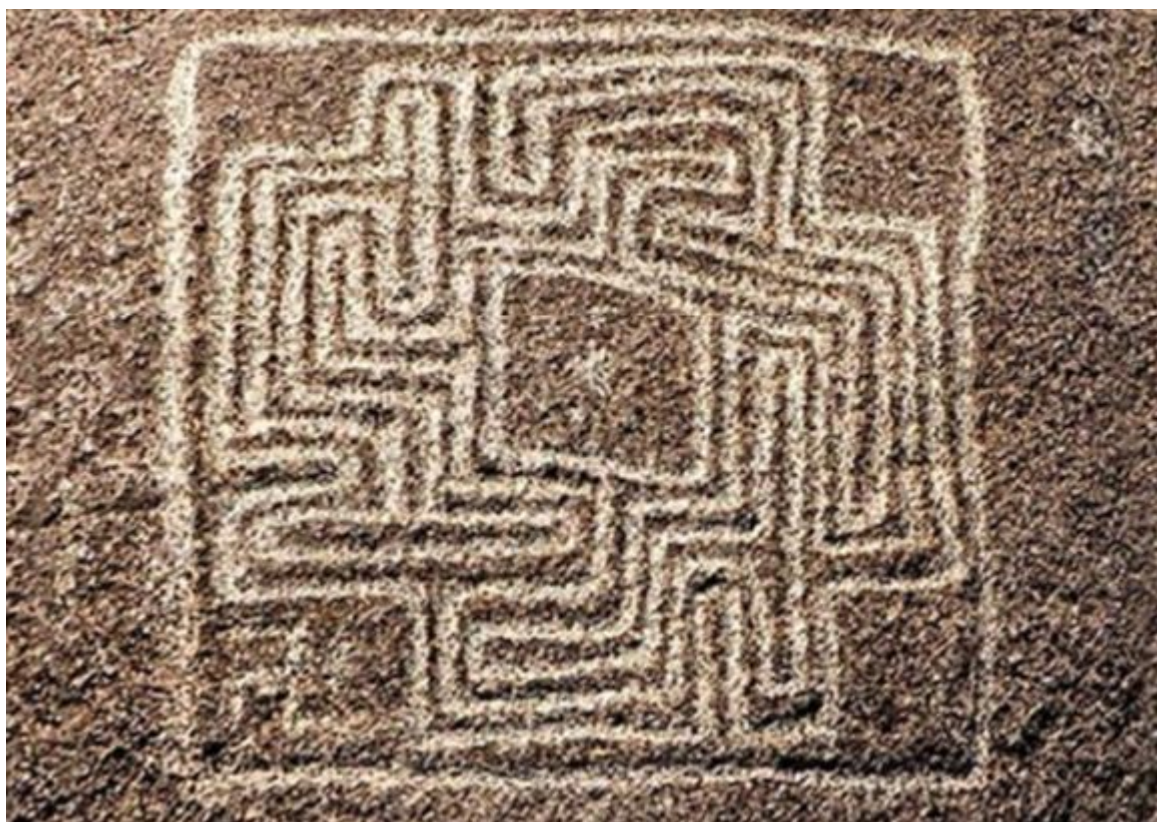
Hemet Maze Stone