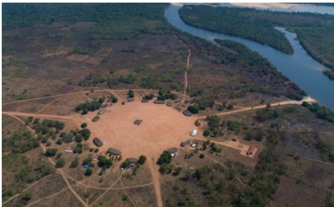
Kruhová vesnice etnika Kuikuro v centrální Brazílii stojí v místech, kde před šesti sty lety zmizela amazonská metropole Kuhikugu