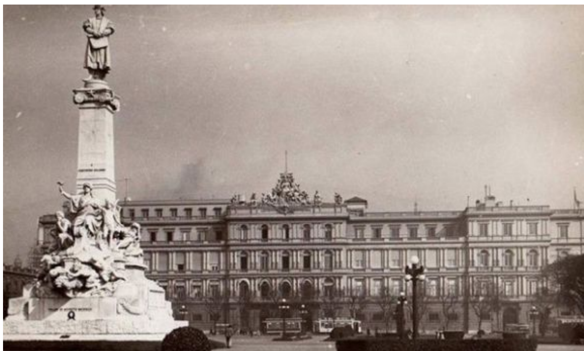
Pomník Kryštofa Kolumba v Buenos Aires (1930, dílo italského sochaře Arnaldo Zocchiho)