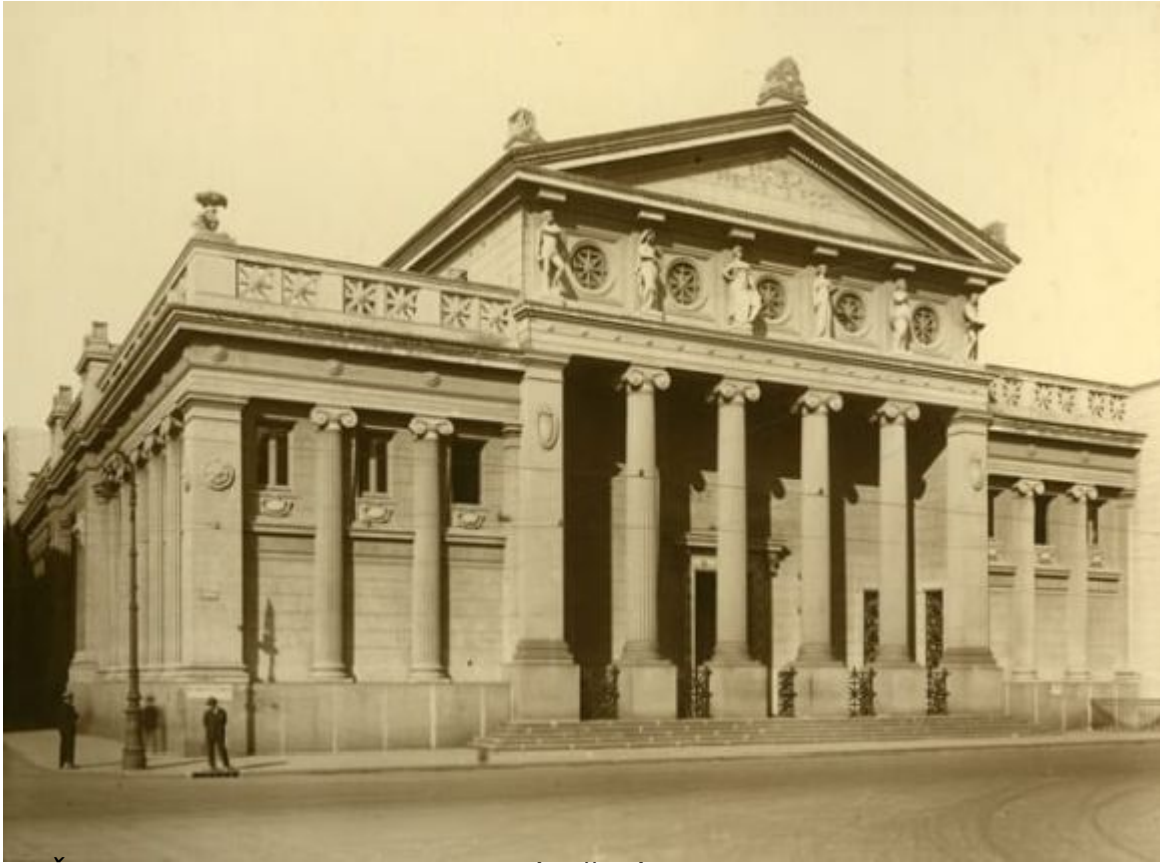
Škola prezidenta Roca na Náměstí Plaza Lavalle v Buenos Aires

Kolumbovo divadlo ( Teatro Colón ) bylo postaveno v roce 1908.