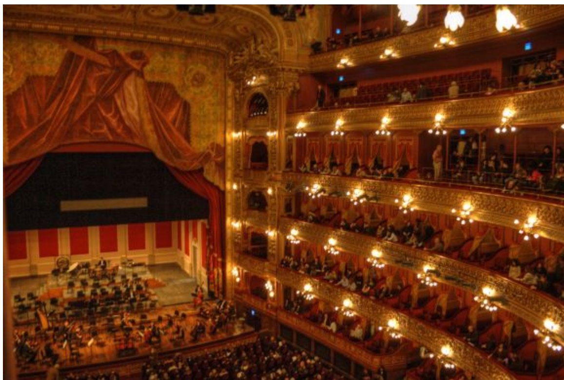
Teatro Colón (Kolumbovo divadlo) v Buenos Aires

Italská komunita v zemi pak stála za vybudováním pomníku Kryštofa Kolumba v Buenos Aires z roku 1921. Byl to jejich výraz díky nové zemi. Váží 623 tun a je 26 metrů vysoký. Byl vytesán z jediného kusu mramoru Carrara, lodí dopraveného z Itálie a sestaveného v Buenos Aires. V roce 2013, kdy venezuelský prezident Hugo Chávez obvinil italského objevitele z genocidy, však byl monument odstraněn a nahrazen sochou mestické hrdinky.