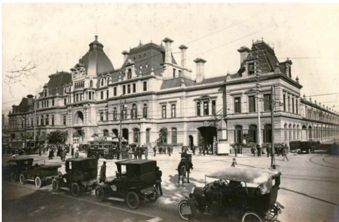
Estación Constitución v Buenos Aires

Ve 20. letech minulého století ovládla hudba k tangu i pařížské taneční sály a spolu s jazzem a foxtrotem udávaly rytmus dobové módy a zábavy. Nepřekonatelný zpěvák a tanečník tanga Carlos Gardel , potomek imigrantů a hvězda filmů jako Tango na Broadwayi , se mohl stát příštím Rudolphem Valentinem. Roku 1935 však zahynul ve věku pouhých 44 let při leteckém neštěstí.