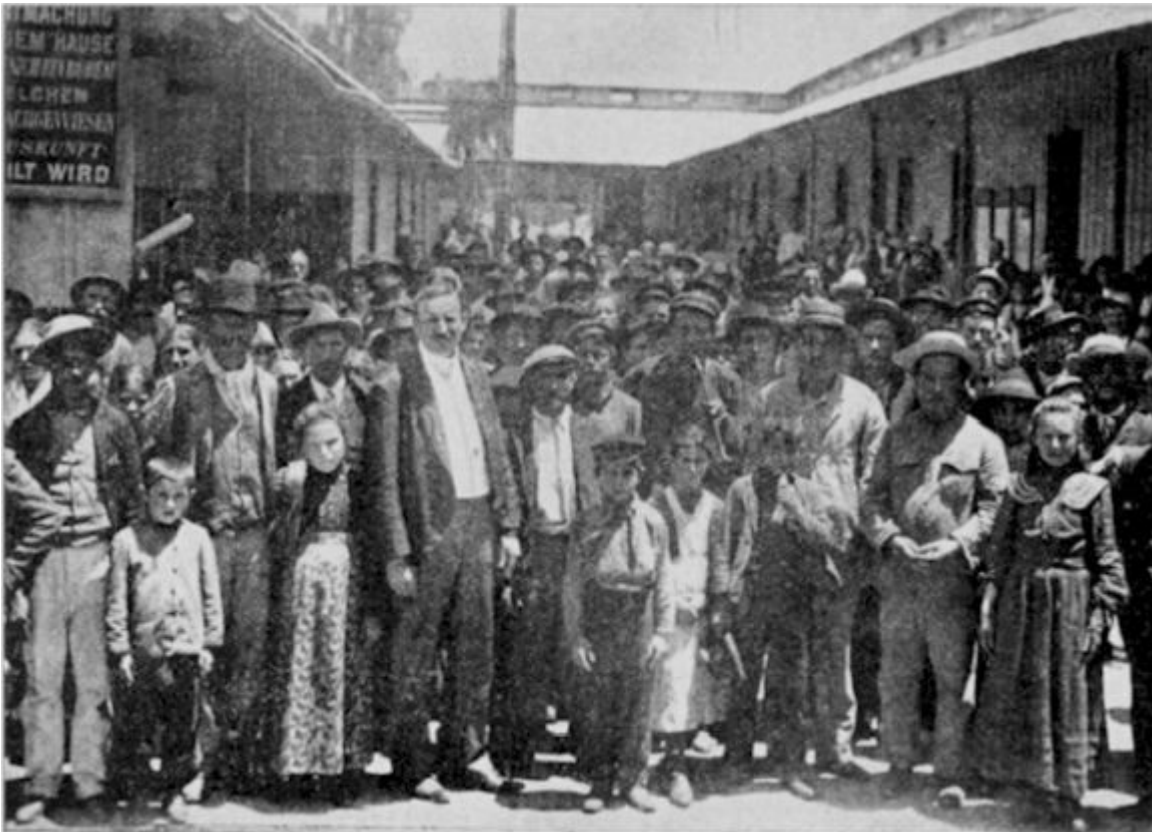
Italští přistěhovalci před Hotel de Inmigrantes