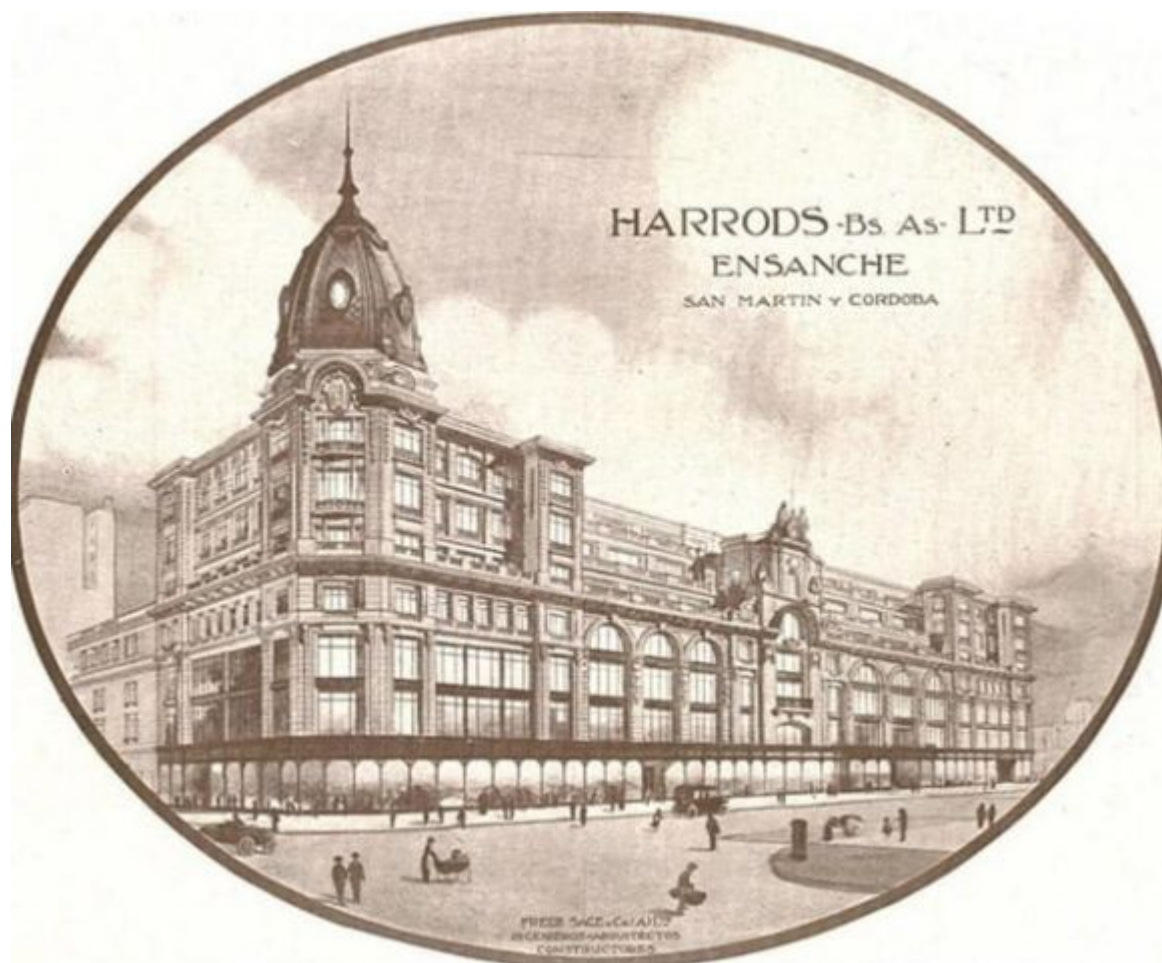
Obchodní dům Harrods v Buenos Aires

Skoro padesát tisíc kilometrů kolejí spojilo celou zemi jednou z nejkvalitnějších železničních sítí na světě. Ohromná nádraží tuto velkolepou minulost dodnes připomínají. Takto vypadalo hlavní nádraží Constitución (celým názvem Nádraží náměstí Ústavy – pozn. DP) v roce 1920: