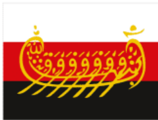
Национальная организация русских мусульман